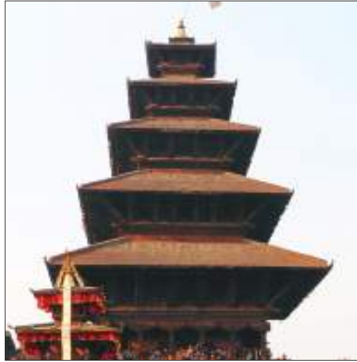
तले शैलीको न्याँतपोल मन्दिर, भक्तपुर