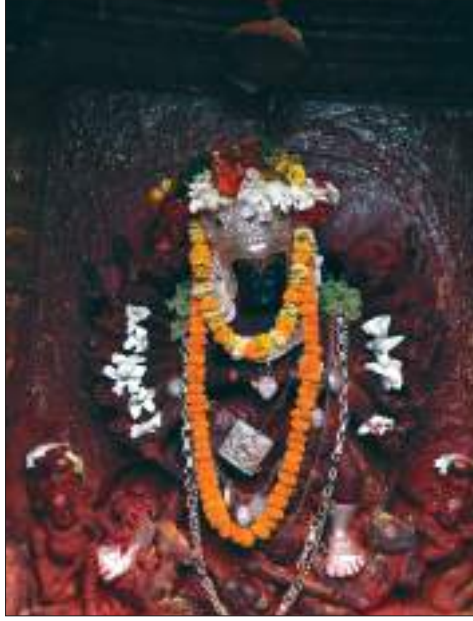
पलाञ्चोक भगवती, काभ्रेपलाञ्चोक

मूर्तिहरू बनेको पाइन्छ। यस युगमा प्रचलित केही मूर्तिहरू-विष्णुविक्रान्त मूर्तिहरू, राष्ट्रिय सङ्ग्रहालयकी पद्महस्ता लक्ष्मी मूर्ति, आर्यघाटको विरूपाक्ष मूर्ति, हनुमानढोकाको कालियदमन मूर्ति (हनुमानढोका, काठमाडौं), विश्वरूप (चाँगु), बोधिसत्व (गणवहाल) जस्ता मूर्ति उत्कृष्ट भएकाले यो युग कलामा सुवर्ण युग नै भएको मानिन्छ। यस कालका बौद्ध र बोधिसत्वका पर्याप्त मूर्तिहरू भेटिन्छन्। ढक्कावहा चैत्यको पद्मपाणि लोकेश्वर मूर्ति, बाङ्गेमुढाको स्थानक बुद्धमूर्ति, बुढानीलकण्ठको जलाशय नारायण मूर्ति, चण्डोलको धूमवराह मूर्ति,