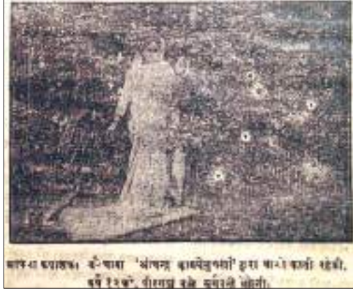
गोरखापत्रमा प्रकाशित पहिलो तस्बिर