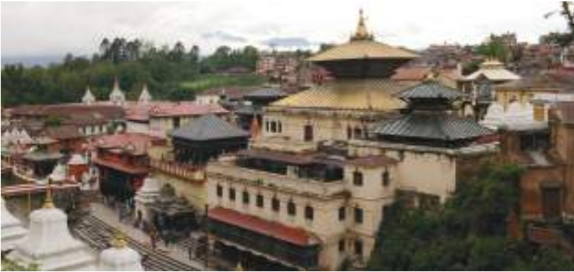
पशुपतिनाथ मन्दिर, काठमाडौँ

बागमती नदी किनारमा रहेको पशुपतिनाथको मन्दिर हिन्दूहरूको पवित्र मन्दिर हो । यो शिवजीको अति प्रसिद्ध मन्दिर हो । यो मन्दिर विश्वसम्पदा सूचीमा सूचीकृत गरिएको छ । यहाँ महाशिवरात्रिको पर्व धुमधामले मनाइन्छ । यो हिन्दू वास्तुकलाको उच्चतम नमुना हो । दुई तले यो भव्य मन्दिर तामाको छानालाई सुनको मुलम्वा गरिएको छ । शिवको वाहन (नन्दी) को सुनको मूर्ति मन्दिरको पश्चिममा राखिएको