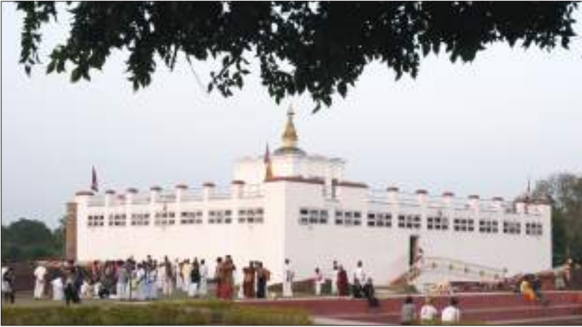
मायादेवीको मन्दिर, लुम्बिनी

ख) लुम्बिनी, भगवान् बुद्धको जन्मस्थल, विश्वसम्पदास्थल