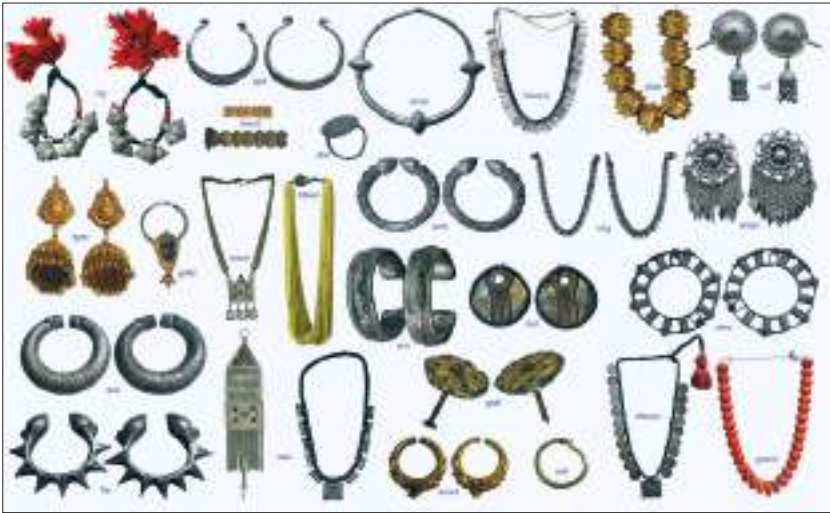
नेपालका केही परम्परागत गरगहनाहरू

विभाजनअनुसार तराई, पहाड र हिमालको बसोबास, रहनसहन र भेषभूषामा भएको विविधतालाई तल चर्चा गरिएको छ ।