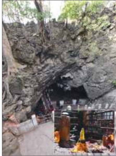
हलेसी महादेव, खोटाङ

खोटाङ जिल्लाको सदरमुकाम दिक्तेलदेखि पश्चिम भागमा कैलाश पर्वत भनिने थुम्को २०० फिटको उचाइसम्म प्राकृतिक रूपमा निर्मित शिवलिङ्ग आकारको संरचनालाई हलेसी महादेव भनिन्छ । बाहिरी चारओटा ढोका रहेको यो गुफाभित्र निष्पट्र अन्धकार छ । हलेसी गुफामा प्राकृतिक आकृतिहरू र धार्मिक आस्थाको मनोरम समन्वय भएको छ । यहाँ रामनवमीका अवसरमा १६ दिनसम्म मेला लाग्दछ । सो अवसरमा यहाँ सबैभन्दा बढी मानिसहरूको जमघट हुन्छ । महाशिवरात्रिका दिन भोटे जातिक मानिसहरू यहाँ आएर सुम्निमा पारोहाडका रूपमा शिव-पार्वतीको पूजा गर्दछन् भने बालाचतुर्दशीका दिन यहाँ टाढाटाढाबाट मानिसहरू आएर शतबीज छर्दछन् ।