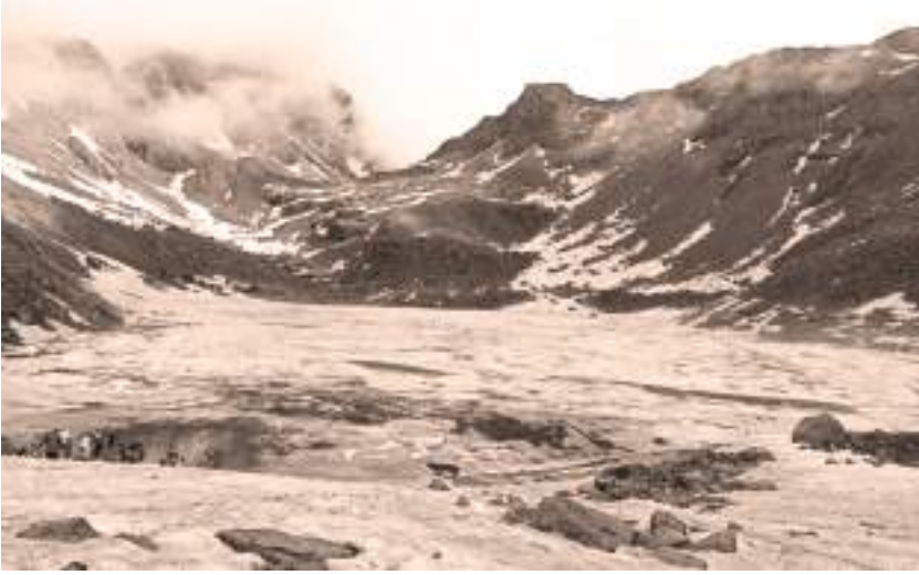
बुढीनन्दा ताल, बाजुरा

बाजुरा जिल्लामा अवस्थित धार्मिक एवम् पर्यटकीय ऐतिहासिक पावन क्षेत्र बुढीनन्दा मन्दिर शैपाल हिमालको दक्षिणी हिमशृङ्खला, उत्तरमा फुलैगुम्बा र सैन पाटन, पादुका त्रिवेणी धाम र कोल्टी विमानस्थलबाट उत्तरतिर पर्छ। प्राकृतिक सुन्दरताले भरपूर दैवी क्षेत्रमा सानाठुला गरी सातओटा ताल छन्। सबै ताल चट्टानमै अवस्थित छन्। मन्दिरसँगै जोडिएको 'निजार ताल' तिलिचो तालपछि विश्वको सर्वाधिक दोस्रो उचाइमा रहेको 'अल इन्फो नेपाल' नामक पुस्तकमा बताइएको छ। दुई ठुला पहाडको बिच गोलो आकारमा चट्टानैचट्टानमा अवस्थित ताल समुद्री सतहबाट ४ हजार ५ सय ८१ मिटरको उचाइमा रहेको छ। तालको लम्बाइ, चौडाइ र गहिराइको विस्तृत अध्ययन हुन बाँकी नै छ। तालको परिक्रमा गर्न तन्नेरीलाई भन्डै एक घण्टा लाग्छ। बुढीनन्दा निजार तालसँगै जोडिएका क्रमशः मष्टा ताल, कैलाश ताल र करिब तिस-चालिस मिटर मात्रै पर रहेको लङ्कारी (राक्षस) दह (ताल) छ। लङ्कारी दहको छुट्टै विशेषता छ। सो दहमा राक्षस बस्ने गरेको जनविश्वास रहँदै आएको छ। निजार दह हुँदै आएको पानी ठुलो भरना भएर बगेको दृश्यले मनै आह्लादित तुल्याउँछ। भरनाको पानी र आसपासबाट निस्किएका अन्य मूलको पानी मिसिएर नागवेली रूपमा लडीबुडी खेल्दै सेतो दुधभैँ बग्दै लेकदेखि बेंसीसम्मका स्थानीय गाउँबस्तीका खेतीबारी सिञ्चन गरेर पादुका त्रिवेणी धाम कर्णालीमा आएर मिसिन्छ। बुढीनन्दाको नाम यसरी रहन गयो भन्ने आधार अहिलेसम्म कतै भेटिएको छैन। स्थानीय एकथरीको भनाइअनुसार 'सतिदेवीको देब्रे हातको बुढीऔँला पतन भएको हुनाले बुढीनन्दा नाम रहन गएको हो।' अर्काथरीको भनाइअनुसार 'सतिदेवी र नौ