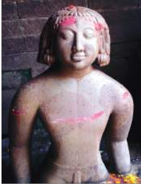
विरूपाक्ष, आर्यघट, पशुपति

किराँतकालका प्रसिद्ध मूर्तिहरू हुन्। हाँडीगाउँ सत्यनारायण मन्दिर निकटस्थ पुरुष मूर्तिलाई अन्तिम किराँत शैलीको नमुना मानिन्छ। मनुष्यकार प्राचीन प्रस्तर मूर्तिमा विरूपाक्ष सुन्दर र उत्कृष्ट छ र यसको कथा युनानी इडिपसको कथासँग मिल्दोजुल्दो छ। तिलौराकोट (तराई) वनजरहीमा प्राप्त नारी शिर मृण्मय (टेराकोटा) इसापूर्व तृतीय शताब्दीको मानिन्छ। यहाँको माता र शिशु इ.पू. द्वितीय शताब्दीको हो। यस युगमा प्रचलित केही मूर्तिहरू-च्यासलहिटिकी गजलक्ष्मी, हौगलवहाल पाटनकी मातृकय, सिकुवही पाटनको उमामहेश्वर र राष्ट्रिय सङ्ग्रहालयको कुमारसम्भव शिलाफलक आदि रहेका थिए। यस युगको मूर्तिकलाका मुख्य विशेषताहरू :