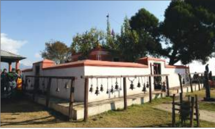
आलमदेवी मन्दिर, स्याङ्जा

चारैतिरबाट पर्खालले घेरिएको छ । यहाँ कुनै देवीको मूर्तिलाई भन्दा पनि आत्मिक तथा भावनात्मक शक्तिपीठको रूपमा पूजा गरिनु यसको मौलिक विशेषता रहेको छ । देवीको पूजा गर्नाले शत्रुको नास हुने, आरोग्य मिल्ने, ठुलो सङ्कटबाट पार पाउने, मनमा चिताएको इच्छा तथा भाकल पूरा हुने र देवीको भक्त तथा उपासकहरूले युद्धमा विजय प्राप्त गर्ने विश्वास गरिन्छ ।