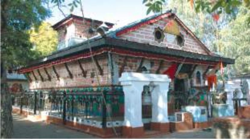
शैलेश्वरी मन्दिर, डोटी

पनि एक दिनमा पुग्न सकिने र खण्ड राष्ट्रिय निकुञ्जमा रहेका दुर्लभ र सुन्दर फूल, जडीबुटी, वन्यजन्तु, ताल र खण्ड-खण्ड परेका रमणीय पाटन (मैदान) हरूको अवलोकन गर्ने अवसर पाइने हुनाले पनि दीपायल-सिलगढीको महत्त्व बढ्न गएको छ। सुदूरपश्चिम प्रदेश डोटी जिल्लाको सिलगढीमा प्रसिद्ध धार्मिक स्थल शैलेश्वरी मन्दिर छ। शैलेश्वरीको उत्पत्तिका सम्बन्धमा स्थानीय बासिन्दाहरूमा प्रचलित एउटा लोकोक्तिअनुसार शिव-पार्वती एक-अर्कामा हाँसखेल गरिरहेको समयमा ब्रह्मा आदि देवताहरू शिव-पार्वतीको खोजी गर्दागर्दै त्यहीं आइपुगेछन्। त्यसपछि पार्वतीले अदृश्य भई शिलाको रूप लिइछन्। त्यसैले यहाँका स्थानीय बासिन्दाहरू शैलेश्वरीलाई शिलादेवी पनि भन्ने गर्दछन्। यसैबाट शैलेश्वरीको अभ्युदय भएको मानिन्छ। शैलेश्वरी मन्दिरको स्थापना पाँच पाण्डवले गराएको हो भन्ने जनविश्वाससमेत रहेको छ। शैलेश्वरीलाई अर्धनारीश्वरका रूपमा समेत पूजाआजा गरिन्छ। शैलेश्वरीमा कात्तिक पूर्णिमाका दिन ठुलो मेला लाग्दछ। बाह्र वर्षमा कुम्भ मेला अर्थात् ६ वर्षमा अर्धकुम्भ मेलासमेत लाग्ने गर्दछ। शैलेश्वरीमा पूजाआजाका लागि छिमेकी राष्ट्र भारतबाट समेत दर्शनार्थीहरूको घुइँचो लाग्ने गर्दछ।