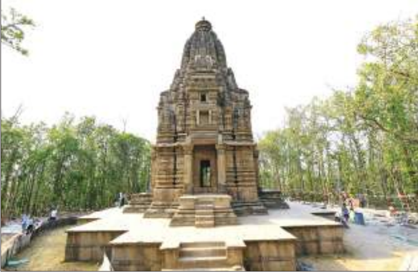
काँक्रे बिहार, सुर्खेत

यहाँका मुख्य धार्मिक तथा पर्यटकीय स्थल हुन्। सुन्दर नगरी वीरेन्द्रनगर गोठीकाँडा डाँडाबाट हेर्दा आकर्षक र मनमोहक दृश्य देखिने भएकाले यस क्षेत्रमा आउने पर्यटक दिनानुदिन बढ्दै गएका छन्।