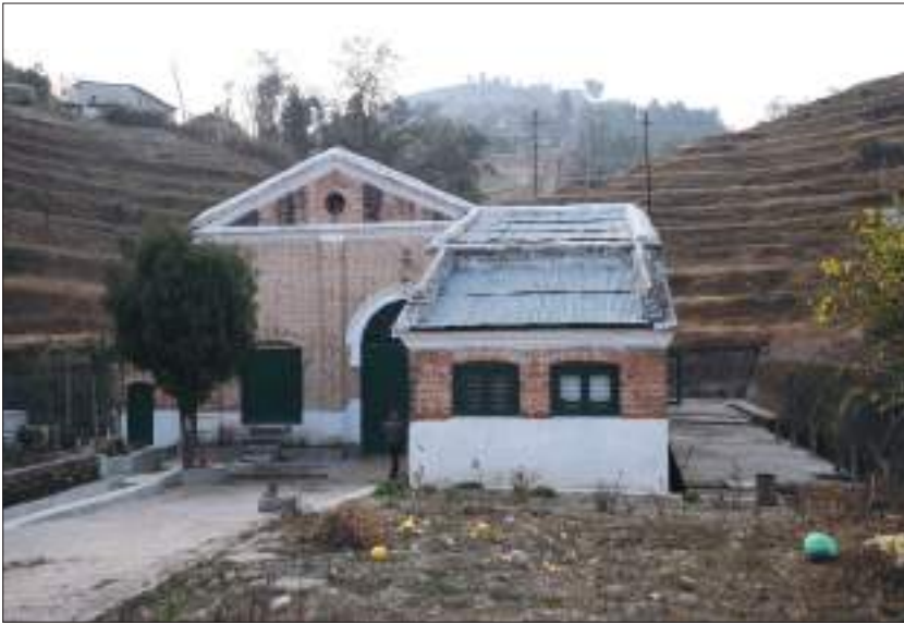
नेपालको पहिलो विद्युत् गृह, फर्पिङ काठमाडौं

लाइन निर्माण सम्पन्न भई देशभित्रका निर्माणाधीन जलविद्युत् तथा प्रसारण आयोजनहरूको निर्माण कार्य तदारुकताका साथ अगाडि बढाउँदै आइएको छ ।