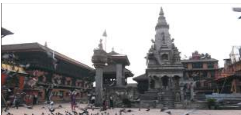
भक्तपुर दरवार क्षेत्र