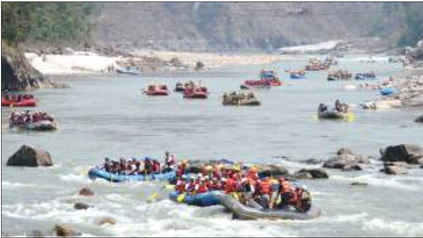
याफ्टिङ गर्दै पर्यटक