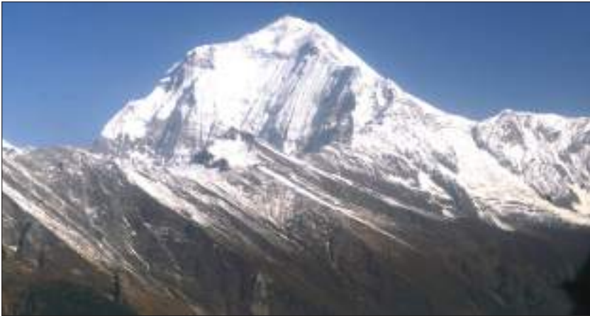
धवलागिरी हिमाल, गण्डकी