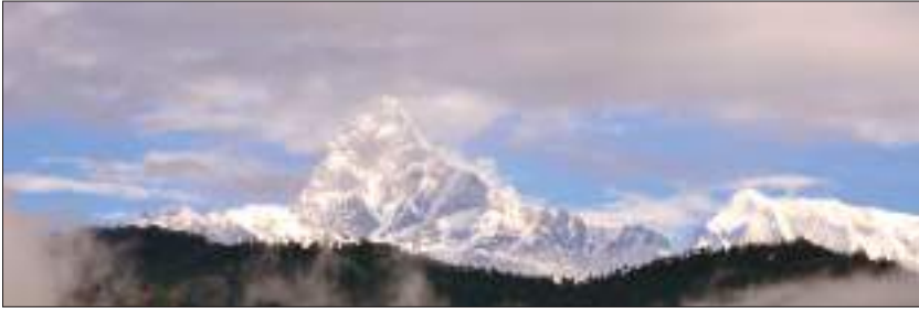
माछापुच्छ्रे हिमाल, गण्डकी

(तिब्बत)का सीमावर्ती क्षेत्रमा रहेका छन्। हिमाली प्रदेश नदीनालाहरूका कारण कैयन् ठाउँमा विशृङ्खलित भएको छ।