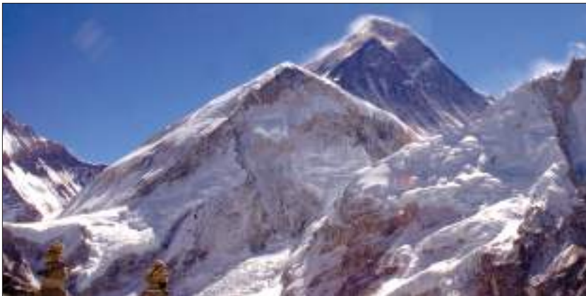
विश्वको सर्वोच्च शिखर सगरमाथा

नेपालको उत्तरी भेगमा उच्च पर्वत, तीव्र ढाल, उच्चतम चुचुराहरू, गहिरा घाँटी र खोंचका ढाडा भरियुक्त भू-स्वरूप भएको तथा निस, सेल, स्लेट, ग्रेनाइट, क्वारजाइट, चून आदि चट्टानबाट निर्मित हिमाली क्षेत्रले नेपालको १५ प्रतिशत भूभाग समेटेको छ । करिब २५ देखि ५० किलोमिटर उत्तर-दक्षिण चौडाईभित्र फैलिएको हिमाली प्रदेश समुद्र सतहदेखि करिब ३,००० मिटरमाथिको उचाइमा अवस्थित छ । हिमालय नेपालको उत्तरपट्टि मात्र नभई उत्तरी नेपाल सरहदबाट दक्षिणतिर हिमाली शृङ्खला देखिने नेपालका धेरै भूभाग छन् । जस्तै : अन्नपूर्ण र गङ्गापूर्ण हिमालको उत्तरपट्टि मनाङ, मुस्ताङ आदि नेपालका क्षेत्र पर्छन् । धवलागिरि चुरेन हिमालयको उत्तरमा मुस्ताङ तथा डोल्पाका भूभाग पर्छन् । ती क्षेत्रबाट हिमालय दक्षिणतिर देखिन्छ । विश्वका उच्चतम र मनोरम हिमाली टाकुराहरू नेपालको हिमालय खण्डमा छन् । कञ्चनजङ्घा, जनक, उम्बक, महालङ्गुर, रोल्वालिङ, पुमरी, जुगल, लाङटाङ, गणेश, सेराङ, कुटाङ, मनसिरी, पेरी, लुगुला, दामोदर, नीलगिरि, अन्नपूर्ण, धवलागिरि, मुस्ताङ, गौतम, पालचुङ हमगा, कान्जिरोवा, कान्ति, गोरखा, चाङ्गला, चण्डी, नालाकङ्कर, गुराँस पूर्वदेखि क्रमशः पश्चिमसम्म फैलिएका प्रसिद्ध २८ हिमशृङ्खला हुन् । यी शृङ्खला अधिकतम भोट