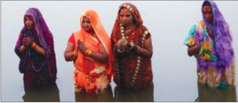
छठ पर्वमा ब्रतालु महिलाहरू

धुमधामले मनाइन्छ। जनकपुरका गङ्गासागर, धनुषासागर, रत्नसागर, अग्निकुण्ड, विहारकुण्ड र पापमोचनीजस्ता तिन सयजति सागर कुण्डहरू तथा पोखरी र २७ ओटा नदीहरूमा ब्रतालुवर्ग सूर्योदयअघि नै नदी किनार गई पानीमा छातीसम्म डुबेर स्नान, ध्यान गरेर सूर्योपासना, आराधना र आरतीका लागि पूर्वको प्रकाशको प्रतीक्षा गर्छन्। सप्तमीको बिहान सूर्योदयअघि जलकिनारामा पुगी सूर्योदयमा नैवेद्यसमेत अर्घदान गरिन्छ। आफ्नो भाकल वा मनोकामना पूर्ण होस् भन्नाका लागि कतिपय ब्रतालुहरूचाहिँ छातीले घसेर नदी किनार वा पोखरीछेउ पुगी आफ्नो कठोर साधनाबाट व्रत पूरा गर्छन्। षष्ठीको साँझ सूर्यास्त हुने वेलामा प्रसाद र नैवेद्यादि लिएर अस्ताउँदो सूर्यलाई प्रणाम गर्दछन्। सूर्योपासनाबाट मनोकामना पूरा गर्न भाकल गर्नेले विशेष रूपमा पूजा गर्ने यो पर्व हाल काठमाडौँ उपत्यकालगायत देशैभरि मनाउन थालिएको छ।