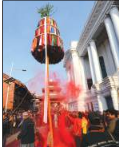
होली पर्व चिरोत्थान

हिन्दू संस्कृतिमा प्रत्येक वर्षको फागुन शुक्ल पूर्णिमालाई होली पूर्णिमा भनिन्छ। यो हिन्दूहरूको एउटा महत्त्वपूर्ण चाड हो। होली रङहरूको चाड हो। फागुन महिनामा मनाइने हुनाले यस चाडलाई फागु पूर्णिमा पनि भनिन्छ। फागुन शुक्ल अष्टमीको दिन काठमाडौँको वसन्तपुर दरबारअगाडि चीर (विशेष रूपले सजाएको लिङ्गो) गाढेपछि होली सुरु भएको मानिने फागु पर्व पूर्णिमाको राति उक्त चीरलाई ढालेर जलाएपछि समाप्त भएको ठानिन्छ। होली हिन्दूहरूको अत्यन्त प्राचीन पर्व हो। यस पर्वको वर्णन नारद पुराण, भविष्य पुराणजस्ता प्राचीन ग्रन्थहरूमा पनि उल्लेख गरिएको छ। यो पर्व प्राचीन समयका नास्तिक हिरण्यकश्यपु, तिनका छोरा प्रह्लाद र बहिनी होलिकाको कथासँग जोडिएको छ। यस पर्वमा पहाडमा पूर्णिमाको दिन र तराईमा भोलिपल्ट सार्वजनिक विदा हुन्छ।