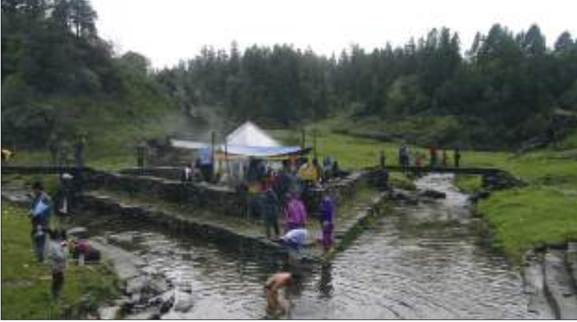
त्रिवेणी मन्दिर, खप्तड

डोटी, अछाम, बझाङ र बाजुरासमेत चार जिल्लामा फैलिएको खप्तड करिब ११,००० फिटको उचाइमा रहेको छ। चारवटै जिल्लाको सङ्गमस्थलमा रहेको यो उच्च पहाडी भूभागमा थुम्काथुम्की, चौर (पाटन) र स-साना खोलाहरू छन्। यो उच्च पहाडी मैदानी भूभागको सरदर चौडाइ पाँच किलोमिटर र लम्बाइ सरदर १० किलोमिटर छ। हिउँले ढाकिएका सेता डाँडा र वन-जङ्गल आफैँमा मनमोहक देखिन्छन्। हिउँले छोडेपछि रङ्गीविरङ्गी फूलैफूलको समथर भूभाग स्वर्गभैँ लाग्दछ। खप्तड प्राकृतिक सुन्दरताको पर्यायको रूपमा रहेको छ। खप्तडको पर्यटकीय दृष्टिले विकास गर्न सकेमा पश्चिम नेपालको विकासमा यसबाट महत्त्वपूर्ण योगदान पुग्ने छ।