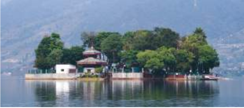
फेवा ताल, कास्की

कास्की जिल्लाको पोखरामा रहेको फेवातालको लम्बाइ ४.८ कि.मि., चौडाइ १.५ कि.मि. र गहिराइ २४ मि. रहेको छ। यो तालमा माछापुच्छ्रेको छाया देखिने हुनाले बडो मनमोहक हुनाका साथै पर्यटकीय दृष्टिकोणले महत्त्वपूर्ण छ।