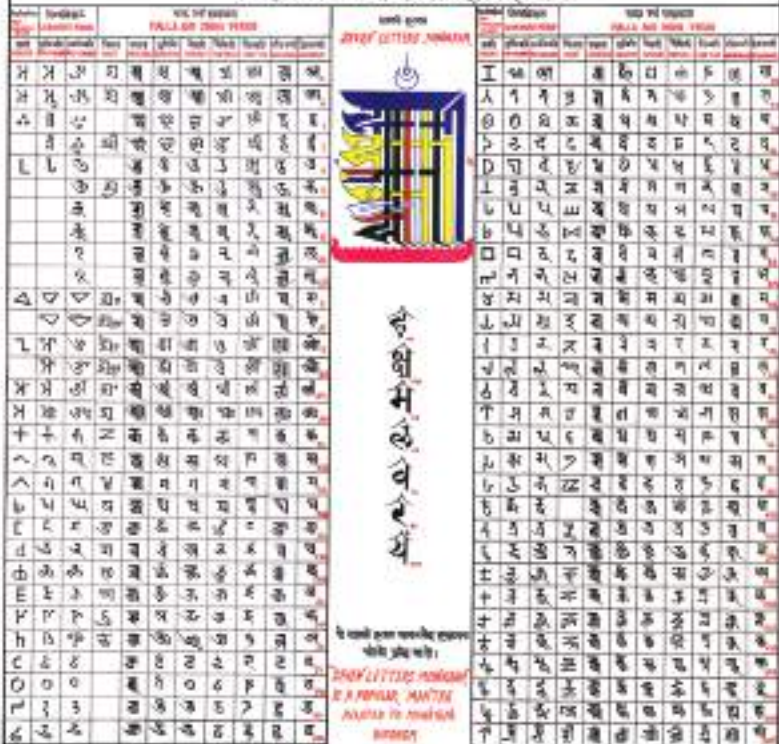
लिपि विकास तालिका

बङ्गाली लिपिको प्रभाव पनि रहेको विश्वास गरिन्छ। मध्यकालको उत्तरार्द्धतिर नेवारी लिपिका अनेकौँ स्वरूप विकसित भए। मध्यकालीन नेवारी लिपिका यी भिन्न