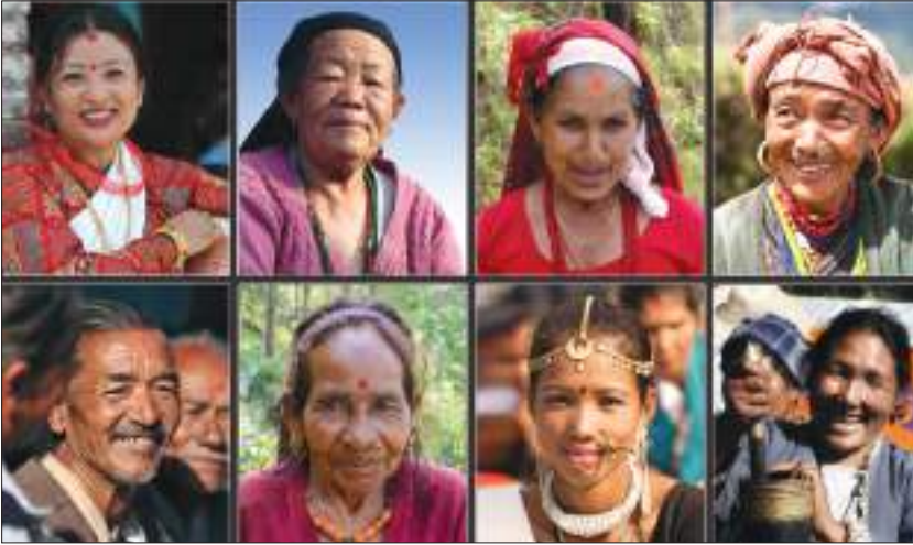
केही नेपाली मुहारहरू

क्षेत्रफलको हिसाबले नेपाल विश्वको मध्यम आकारको मुलुक मानिन्छ। यद्यपि नेपाल विविधताले भरिपूर्ण छ। नेपालमा भौगोलिक, जातीय, भाषिक, धार्मिक तथा सांस्कृतिक विविधता स्पष्ट देख्न पाइन्छ। यसर्थ, नेपाल बहुजातीय, बहुभाषिक, बहुधार्मिक र बहुसांस्कृतिक देश हो। क्षेत्री, ब्राह्मण, मगर, थारू, तामाङ, नेवार, मुसलमान, कामी, यादव, राई, गुरुङ जस्ता जनसङ्ख्याको आकारका हिसाबले ठुला जनजातिलागायतका १२५ जातजातिका मानिसहरू यहाँ बस्छन्। यिनीहरूको मातृभाषाको रूपमा आ-आफ्नै भाषा छन्। यहाँ १० ओटा धर्म मान्ने मानिसहरू बस्छन्। हिन्दू धर्म मान्ने