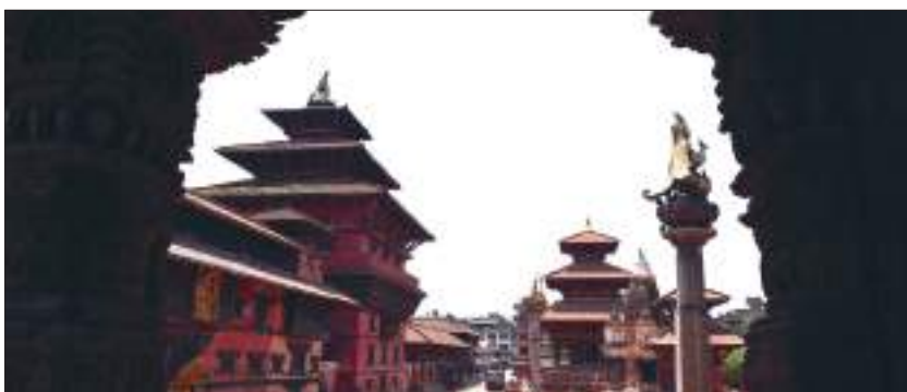
पाटन दरवार क्षेत्र