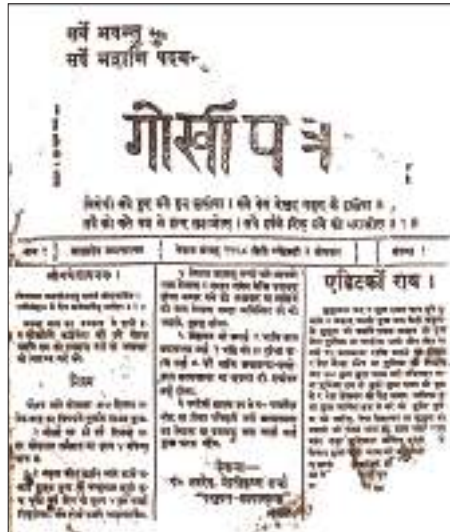
गोरखापत्रको पहिलो अंक