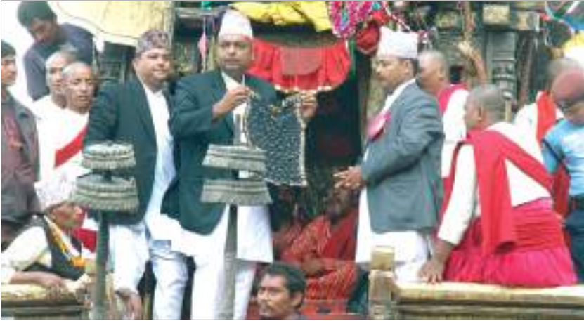
भोटो जात्रा, ललितपुर

काठमाडौँ उपत्यकाका संरक्षक तथा प्राणीजगत्का पालनकर्ता भगवान् लोकनाथलाई रातो मच्छिन्द्रनाथ भनिन्छ। मच्छिन्द्रनाथलाई दूध, दहीको महास्नान गराउनुको