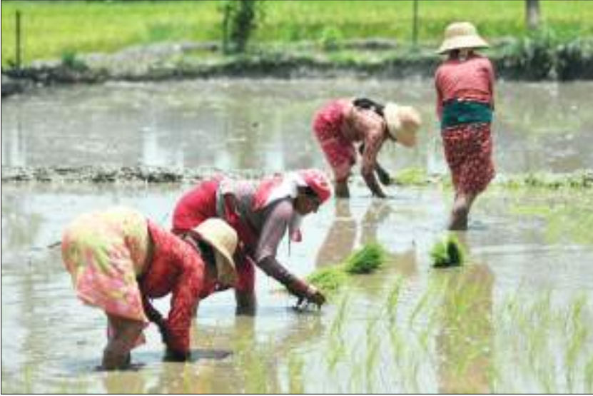
धान रोपै रोपार

नेपाल विकासोन्मुख मुलुक हो । संयुक्त राष्ट्रसङ्घले सन् १९७१ मा नेपाल अतिकम विकसित राष्ट्र भएको उल्लेख गरेको थियो । नेपालमा न्यून प्रतिव्यक्ति आय, राष्ट्रिय आम्दानीको असमान वितरण, अधिकांश जनता कृषिमा निर्भर रहनु तथा रोजगारीमूलक व्यावसायिक शिक्षाको अभाव आदि कारणले गर्दा नेपाल विश्वका गरिव मुलुकहरूमा रहँदै आएको छ । गरिवीका अन्य कारणमा बसाइँसराइ, शिक्षाको अभाव, जनचेतनाको अभाव, भूपरिवेष्ठित अर्थतन्त्र, आयातमा बढी जोड तथा प्राकृतिक साधनहरूको उचित सदुपयोगको अभाव आदि रहेका छन् ।