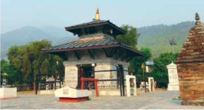
वैजनाथ धाम, अछाम

वैजनाथ धाम अछाम जिल्लाको बुढीगङ्गा र साँफे खोलाको किनारमा पर्दछ। शिवरात्रिको समयमा यहाँ ठुलो मेला लाग्छ। यहाँ नेपालका विभिन्न स्थानदेखि भारतसम्मबाट श्रद्धालुको ठुलो भिड लाग्दछ।