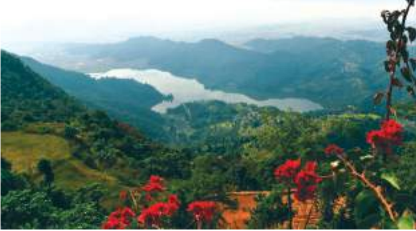
रूपा ताल, कास्की

कास्की जिल्ला पोखराको पूर्व उत्तरी भागमा पचभैया पर्वतको फेदमा रूपा ताल छ । समुद्री सतहबाट ७०१ मिटरको उचाइमा अवस्थित ४.५ मिटर गहिराइ भएको रूपा ताल १२० हेक्टर क्षेत्रफलमा फैलिएको छ । यो तालमा हाल मत्स्यपालन गरी आर्थिक लाभ लिन थालिएको छ ।