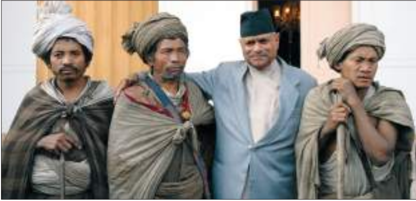
राउटे समुदायसँग पूर्वराष्ट्रपति डा. रामवरण यादव

राउटे वनसम्पदामा आधारित नेपालको एक मात्र घुमन्ते जाति हो । यिनीहरू मुख्य रूपमा डोटी, दार्चुला, अछाम, दैलेख, जाजरकोट, कालिकोट तथा सुर्खेतमा बस्छन् । वनदेवी, दारेमस्त तथा भुयार देवता मान्दछन् । यिनीहरू भोटवर्मेली परिवारको खाम्ची भाषा बोल्दछन् । यिनीहरू एक महिनाभन्दा बढी एकै ठाउँमा कहिल्यै बस्दैनन् र त्यस ठाउँमा फर्केर आउँदैनन् । यिनीहरू अस्थायी रूपमा बस्ने ठाउँलाई राउटी भनिन्छ भने अस्थायी छाप्रालाई थौला भनिन्छ ।