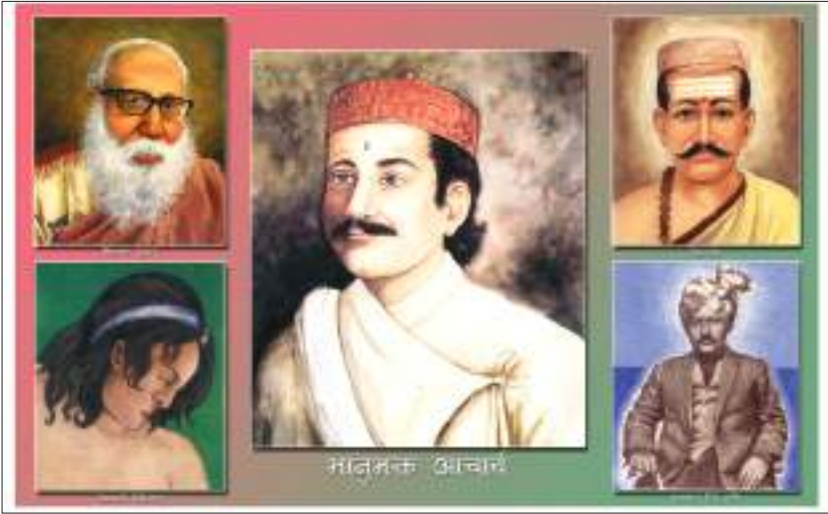
हाम्रा अग्रज साहित्यकारहरू

नेपाल बहुभाषी देश हो । नेपालको संविधानले नेपालमा बोलिने सबै मातृभाषालाई राष्ट्रभाषाको मान्यता दिएको छ । नेपाली भाषा सरकारी कामकाजको भाषा हो । नेपाली भाषा सम्पर्कको भाषा पनि हो । प्राचीन नेपालमा किराँत, संस्कृत, पाली आदि भाषा र ब्राह्मी, सिरिजङ्घा, देवनागरी, रञ्जना आदि लिपि विकसित हुँदै गएको पाइन्छ । उत्तरार्द्धमा संस्कृत भाषाको विकास अन्य भाषाको दाँजोमा अत्यधिक मात्रामा भएको पाइन्छ । जयस्थिति मल्लको उदय भएपछि मध्यकालमा नेवारी भाषा लिखित रूपमा सुरुआत भएको हो ।