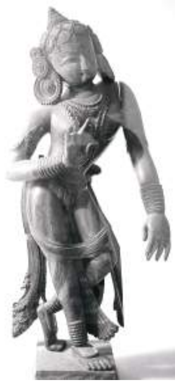
नृत्यदेवी, राष्ट्रिय संग्रहालय

कुम्भेश्वर आदिमा पाइन्छ। टुंडालको माथिल्लो हिस्सामा वृक्ष, मध्यभागमा देवता र तल्लो खण्डमा यक्ष, नर-जनावर तथा यौनाभिनयका विभिन्न आसन आदि चार कोणमा सौन्दर्ययुक्त शार्दूल (भेडाको सिङ्ग, सिंहको शरीर) प्रदर्शन गरिन्छ। मन्दिरको द्वारमाथि अर्धवृत्ताकार तोरण बनाई त्यसको मध्यखण्डभित्रको मुख्य देवता, दायाँ-बायाँ गङ्गा, यमुना, मकरको प्रतीक राख्ने गरेको पाइन्छ। काठका कुँदिएका थाम राख्ने प्रचलन न्यातपोल, काष्ठमण्डप (गोरखनाथ) मा प्रयुक्त छ। काष्ठकला सोह्रौँ-सत्रौँ शताब्दीमा चरम विकासको अवस्थामा थियो। काष्ठमूर्तिका उत्कृष्ट नमुनाहरू मन्दिरमा प्रयुक्त टुंडाल, भ्याल आदिले प्रस्तुत गर्ने गरेको पाइन्छ। मन्दिरका स्थापत्य कलामा बाहिरी भागमा टुंडालमा शृङ्गारमय मूर्ति पाइन्छ।