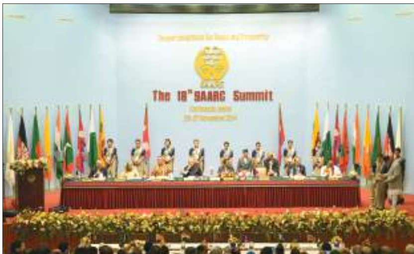
१८औं सार्क सम्मेलन उद्घाटन समारोह, नेपाल

सन् १९८५ डिसेम्बर ७ र ८ मा बङ्गलादेशको राजधानी ढाकामा राष्ट्राध्यक्ष तथा प्रमुखहरूले भाग लिएको प्रथम शार्क शिखर सम्मेलनले दक्षिण एसियाली राष्ट्रहरूको क्षेत्रीय सहयोग सङ्गठन (SAARC) को विधिवत् स्थापना गरी सार्क बडापत्रको अनुमोदन गर्‍यो । दक्षिण एसियाली क्षेत्रीय सहयोग सङ्गठन सार्कमा बङ्गलादेश, भारत, नेपाल, पाकिस्तान, भुटान, श्रीलङ्का, माल्दिभ्स र अफगानिस्तान गरी आठ राष्ट्र रहेका छन् । सार्कको सचिवालय काठमाडौंमा रहेको छ । यसको स्थापना सन् १९८७ जुन १७ मा भएको हो ।