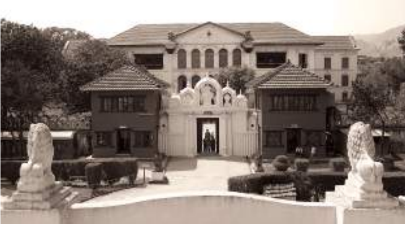
राष्ट्रीय सङ्ग्रहालय छाउनी

जिल्लाका सम्पदाहरूको सूचीकरण भई त्यसैअनुरूपका कार्यक्रमहरू सञ्चालन भइरहेका छन् । साथै, विश्वसम्पदा सूचीमा सूचीकृत सम्पदाहरूको संरक्षणका लागि कार्यक्रमहरू सञ्चालनमा रहेका र पवित्र धार्मिक स्थल देवघाट क्षेत्रको २० वर्षे गुरुयोजना स्वीकृत भएको, अन्य जातीय सङ्ग्रहालयहरू स्थापनाको कार्यलाई निरन्तरता दिई स्थानीय निकाय र समुदायको सहभागितामा धरान, चितवन, कीर्तिपुर, पोखरा, दाङ र जुम्लामा जातीय सङ्ग्रहालय स्थापना कार्य सुरु गरिएको, काठमाडौँको गोकर्णमा जनआन्दोलन तथा सहिद स्मृति सङ्ग्रहालयको पूर्वाधार विकास सुरु गरिएको, नारायणहिटी दरवार सङ्ग्रहालय स्थापना भई केही भाग सर्व साधारणको अवलोकनका लागि खुला गरिएको साथै मैथिली साहित्यका महाकवि विद्यापतिको स्मृति पुरस्कारका लागि रु. १ करोडको अक्षयकोष स्थापना गरिएको छ । लुम्बिनी, पशुपति र जनकपुर क्षेत्रका गुरुयोजनाअनुरूप पूर्वाधार विकाससम्बन्धी क्रियाकलापहरूसमेत सञ्चालन भइरहेका छन् ।