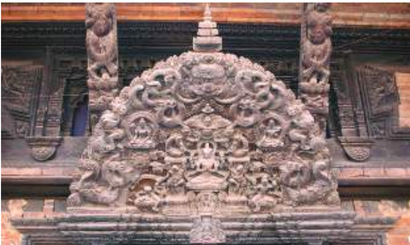
तोरण, गुणाकर महाविहार, छुस्यावहाल

सोह्रौं शताब्दीको इटुमवहालको तोरण, १७औं शताब्दीको भक्तपुर दरबारको मूलचोकको तोरण, प्रताप मल्लको समयको छुस्या वहालको तोरण, उपत्यकाका अरू मन्दिरहरूमा रहेका तोरण आदि प्रवेशद्वारमाथि रहने अर्ध वृत्ताकार तोरण हुन् ।