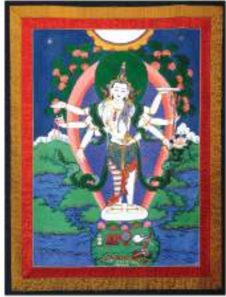
अमोघपास लोकेश्वरको पौभा चित्र

अमेरिकाको काउन्टी म्युजियममा रहेका तेह्रौँ शताब्दीको 'अमिताभ' पौभाचित्र नेपालको प्राचीन पौभाचित्र हो। तेह्रौँ शताब्दीकै 'रत्नसम्भव' र नेपाल संवत् ७२० को 'विष्णुमण्डल' नेपाल संवत् ५५६ तिरको 'अमोघपास अवलोकितेश्वर' पौभाचित्रहरू उल्लेखनीय छन्। धार्मिक सहिष्णुतामा आधारित हुनु, धार्मिक परम्पराका पौभाचित्र हिन्दू र बौद्ध दुवैमा प्राप्त हुनु, पृष्ठ भागमा प्राकृतिक दृश्यहरूको चित्रण हुनु नेपाली पौभाचित्रका विशेषता मानिन्छन्। सोह्रौँ शताब्दीदेखि नेपाली पौभाचित्रमा तान्त्रिक शैलीको प्रवेश भई सोही अनुरूप देवीदेवताहरूको चित्र अङ्कित