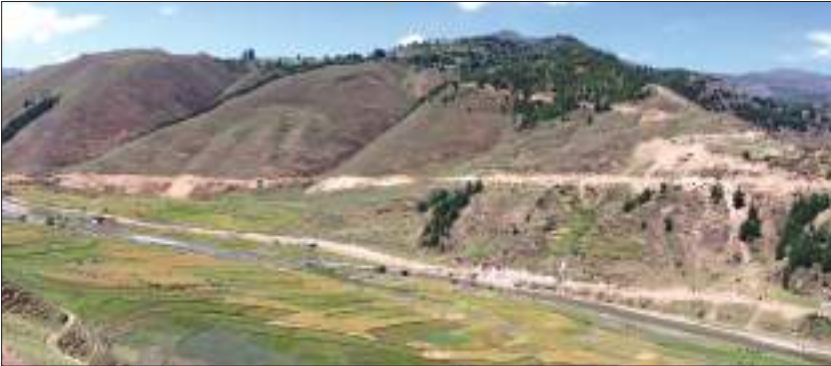
सिँजा उपत्यका, जुम्ला

जुम्ला जिल्लामा पर्ने सिँजा उपत्यका मध्यकालमा नागराजले स्थापना गरेको खस मल्ल राज्यको राजधानीको रूपमा रहेको थियो। त्यसैले नेपालको राष्ट्रभाषा नेपालीको उत्पत्तिस्थलको रूपमा समेत परिचित रहेको सिँजा उपत्यकालाई प्राचीन संस्कृति र सम्पदाको केन्द्रको रूपमा समेत लिनुपर्ने देखिन्छ। कर्णाली प्रदेशको खस मल्ल राज्यले