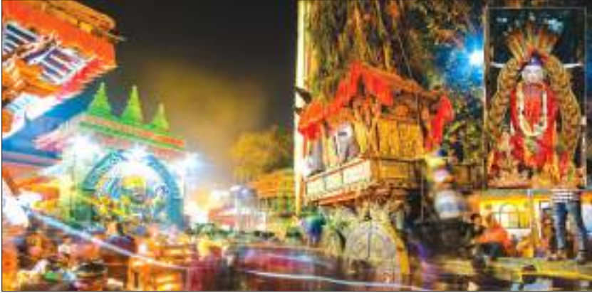
सेतो मच्छिन्द्रनाथ जात्रा

सम्पूर्ण प्राणी जगत्का मालिक आर्यावलोकितेश्वरलाई नै सेतो मच्छिन्द्रनाथ भनिन्छ । नेवारी भाषामा यिनलाई श्रीजनवहाद्य भनिन्छ । आर्यावलोकितेश्वर श्वेत मच्छिन्द्रनाथको मूर्ति र मन्दिर काठमाडौँ केलटोलको मच्छिन्द्रबहाल वा कनक चैत्य विहारको मध्यमा अवस्थित छ । प्राणी मात्रको भलाइको कामना गर्दै दूध, दही आदि द्रव्यले स्नान गराई रङ्गमाला भरेर सुसज्जित गराई चैत्र अष्टमीमा शुभ साइत जुराई रथयात्रा गराइन्छ ।