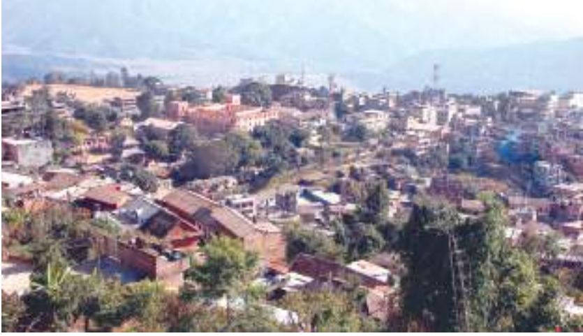
तानसेन सहर पात्या