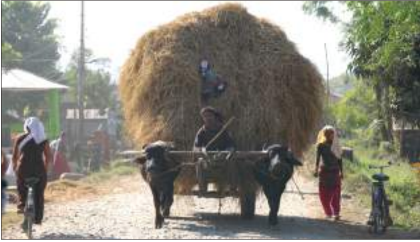
तराईमा सामान ढुवानी गर्न गाडाको प्रयोग

र पहाडी जनजीवनभन्दा सहज रहेको छ। यहाँका मानिसहरूको मुख्य पेसा कृषि हो। यहाँ अलि बढी गर्मी हुनेहुँदा यहाँका मानिस धोती, कुर्ता, लुंगी लगाउने गर्दछन्। यस प्रदेशका मानिसहरूले विशेषतः दाल, रोटी, भात, माछा, दही, दुधजस्ता खानेकुरा खाने गरेको पाइन्छ। तराईमा लक्ष्मीपूजा, छठ, सिरुवा पर्व, माघी पर्वहरू धुमधामसँग मनाइन्छ।