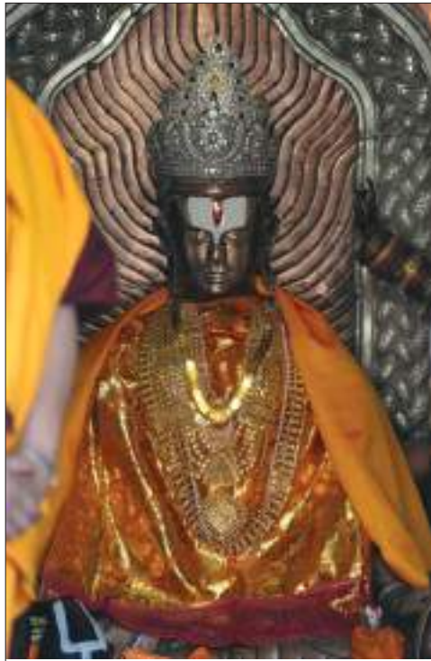
मुक्तिनाथको मूर्ति, मुस्ताङ

मुक्तिनाथ हिन्दूहरूको पवित्र धार्मिक स्थलको रूपमा रहेको छ । बर्सेनि असङ्ख्य भक्तजनहरू टाढाटाढाबाट मुक्तिनाथको दर्शन गर्न आउँछन् । भारतका कुनाकुनाबाट पनि हिन्दू धर्मावलम्बीहरू मुक्तिनाथको दर्शन गर्न आउने हुनाले मुक्तिनाथ नेपालको मात्र नभएर सम्पूर्ण हिन्दूहरूको तीर्थस्थलको रूपमा स्थापित भएको पाइन्छ । प्राकृतिक रमणीयताको कारणले पनि बर्सेनि ठुलो सङ्ख्यामा पदयात्रीहरू यस क्षेत्रमा आउँछन् । यस क्षेत्रमा तपस्या गरेको खण्डमा मुक्ति प्राप्त गर्न सकिने हुनाले यस क्षेत्रलाई मुक्तिक्षेत्र भनिएको हो भन्ने जनविश्वास रहेको