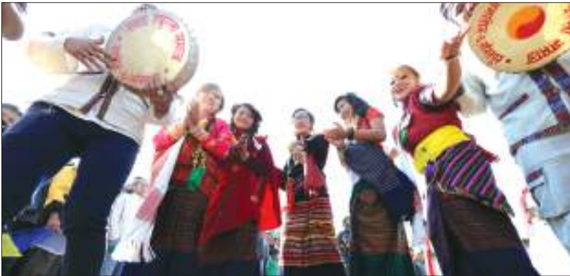
ल्होसार पर्व मनाउँदै