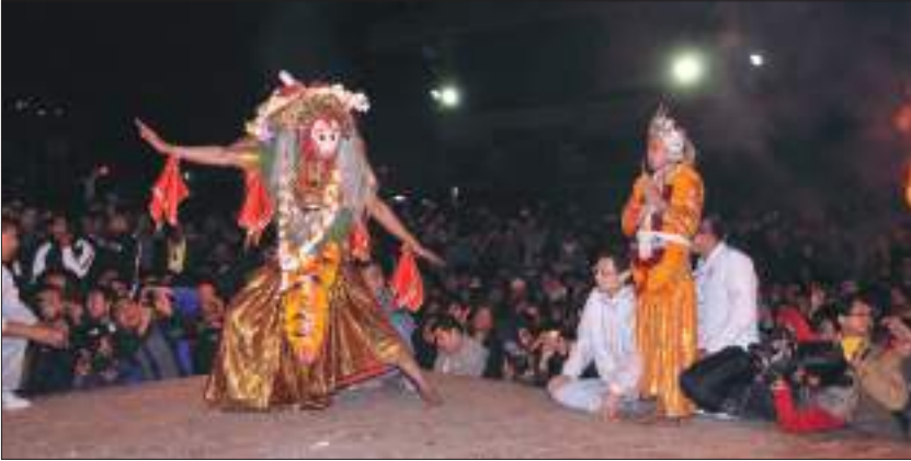
कार्तिक नाच, ललितपुर

प्राचीन कालदेखि नै नेपाल विभिन्न धर्म मान्ने मानिसहरूको बसोबास गर्ने थलो हो। नेपालमा मुख्यतया हिन्दू धर्म र बौद्ध धर्मको बाहुल्यता रहेको छ। यीबाहेक इस्लाम, इसाई, किराँत, वहाई, शिखलगायत अन्य धर्मावलम्बीहरू पनि उत्तिकै स्वतन्त्र रूपमा रहेका छन्। हिन्दू धर्मअन्तर्गत शैव, वैष्णव, शाक्त, सौर्य आदि सम्प्रदाय पर्दछन् भने बौद्ध धर्ममा हिनयान, महायान, वज्रयान, तन्त्र तथा मन्त्रयान, सहजयान र वोन्यो तथा लामा सम्प्रदाय आदि पर्दछन्।