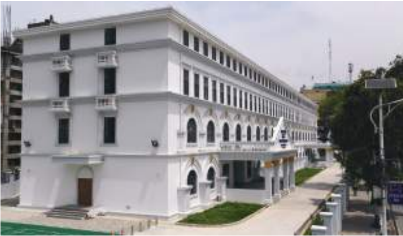
पुनर्निर्माणपछिको दरबार हाइस्कूल, काठमाडौँ

नेपालको संविधानले प्रत्येक नागरिकलाई आधारभूत शिक्षामा पहुँचको हक, प्रत्येक नागरिकलाई राज्यबाट आधारभूत तहसम्मको शिक्षा अनिवार्य र निःशुल्क तथा माध्यमिक तहसम्मको शिक्षा निःशुल्क पाउने हक, अपाङ्गता भएका र आर्थिक रूपले विपन्न नागरिकलाई कानूनबमोजिम निःशुल्क उच्च शिक्षा पाउने हकका साथै नेपालमा बसोबास गर्ने प्रत्येक नेपाली समुदायलाई कानूनबमोजिम आफ्नो मातृभाषामा शिक्षा पाउने र त्यसका लागि विद्यालय तथा शैक्षिक संस्था खोल्ने र सञ्चालन गर्ने मौलिक हकको व्यवस्था गरेको छ। शिक्षा क्षेत्रमा विगतमा भएका नीतिगत, कानुनी,