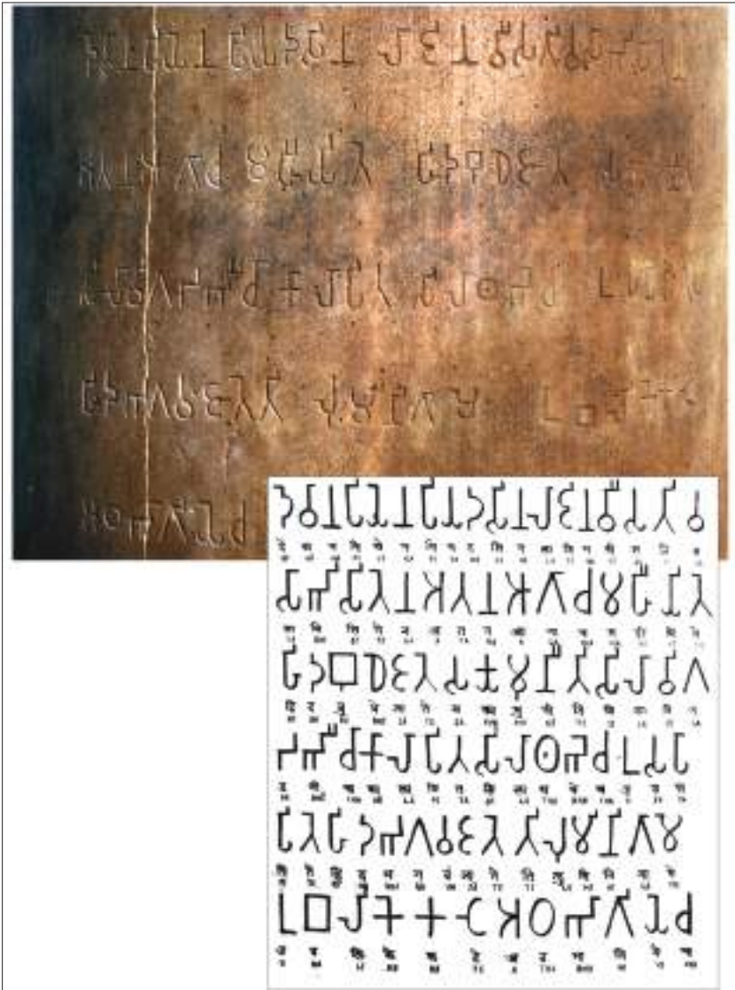
लुम्बिनीको अशोक स्तम्भमा भएको ब्राह्मी लिपिको अभिलेख

स्वरूपहरू भुजिमोल लिपि, रञ्जना लिपि, गोलमोल लिपि, लितुमोल लिपि, पाचुमोल लिपि तथा प्रचलित नेवारी लिपिका नामले परिचित रहेका छन्। यी सबैखाले नेवारी लिपिहरू आरम्भमा संस्कृत भाषा लेखनमा उपयोग भएका थिए भने पछिल्लो मध्यकालमा नेवारी भाषा लेखनमा प्रयोग भएका थिए।