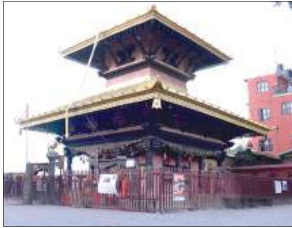
मनकामना मन्दिर, गोरखा