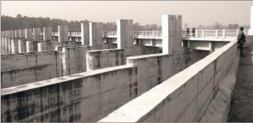
सिक्टा सिंचाइ आयोजना

तथा साभेदारी व्यवस्थापनको आधारमा देशका विद्यमान सतह तथा भूमिगत जल स्रोतको अधिकतम सदुपयोगबाट वर्षेभरि सिँचाइ सुविधा पुऱ्याउने पूर्वाधार विकास गर्दै कृषि उत्पादन तथा उत्पादकत्व वृद्धि गरी गरिवी न्यूनीकरण गर्दै समृद्धितर्फ अगाडि बढ्नु आजको आवश्यकता हो ।