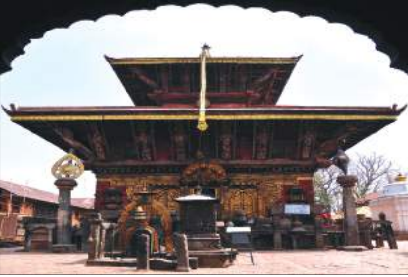
चाँगुनारायण मन्दिर, भक्तपुर

नयाँ शासन व्यवस्था कायम गरेको पाइन्छ। गोपाल राजवंशावलीमा 'अनि सूर्यवंशको प्रभावले नेपालमा किराँत राजालाई जितेर लिच्छवि राजवंश चल्थो' भनी लेखिएको छ भने पशुपति पुराणमा पनि 'किराँतहरूलाई बोलिवचनले विश्वासमा पारेर तथा युद्धमा परास्त गरेर वैशालीका स्वामी वा पतिहरूले आफ्नो शासनसत्ता कायम गरेको' भन्ने उल्लेख यसै प्रकारको सन्दर्भ हिमवत्खण्डमा पनि पाइन्छ। जसमा वैशालीका स्वामीहरूले किराँतहरूलाई जितेर नेपालमा शासन सुरु गरेको उल्लेख छ। यस प्रकार नेपालमा लिच्छवि शासन व्यवस्थाको थालनी किराँतीहरूको शासनपछि लगत्तै सुरु भएको देखा पर्दछ। गोपाल वंशावलीअनुसार अन्तिम किराँती राजा 'खिगु', भाषा वंशावलीअनुसार 'गालिज', राइट वंशावलीअनुसार किराँत राजा 'गस्ति' लाई परास्त गरेर वा धपाएर लिच्छवि राजवंशले नेपालमा शासन सुरु गरेको देखिन्छ।