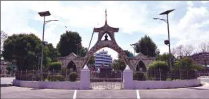
सहिद गेट, काठमाडौं