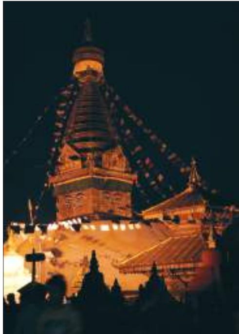
स्वयम्भू महाचैत्य, काठमाडौँ

प्रसिद्ध बौद्ध तीर्थस्थल स्वयम्भू काठमाडौँ उपत्यकाको पश्चिमी भागमा पर्ने पद्मगिरी (बज्रकुट/गोशुङ्ग/गोपुच्छा गिरि) पर्वतमा अवस्थित छ । स्वयम्भू अर्थात् आफैँ उत्पत्ति भएको हुनाले स्वयम्भू भनिएको हो । स्वयम्भूको उत्पत्ति उपत्यकाको कालीदहमा श्री विपस्वी तथागतले रोप्नुभएको कमलको बीजबाट एक हजार पत्ता भएको कमलको फूलबाट पञ्चरश्मिको रूपमा भएको हो । यस पवित्र रश्मिको दुरुपयोग नहोस् भन्नका लागि गौड देशबाट आएका राजा प्र चण्डदेवले सो रश्मिलाई छोपेर विधिवत् स्वयम्भू महाचैत्यको प्रतिष्ठा गर्नुभयो । चैत्य निर्माण