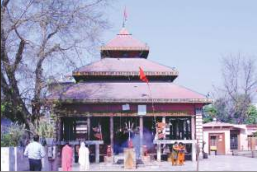
बागेश्वरी मन्दिर, नेपालगञ्ज

यातायात र सडक यातायातको सुविधा छ। यहाँ चामल, काठ, सलाई, कत्या, बिस्कुट आदि निर्माण गर्ने कारखानाहरू सञ्चालित छन्।