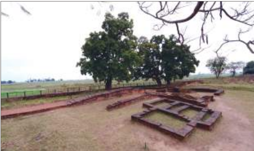
तिलौराकोट पूर्वीद्वार, कपिलवस्तु

कपिलवस्तु जिल्लामा तिलौराकोट नामक स्थान रहेको छ । प्राप्त तथ्यहरूका आधारमा यो तिलौराकोट नै शाक्यहरूको प्राचीन कपिलवस्तुको राजधानी थियो । प्राचीन गणराज्यहरूमध्ये शाक्यहरूको यो राज्य विशेष उल्लेखनीय थियो, किनभने ऋकुछन्द, कनकमुनि, सिद्धार्थ गौतमलगायतका बुद्धहरूको जन्म यही स्थानमा भएको थियो । उनै सिद्धार्थ गौतम बुद्धधर्मका प्रवर्तक महात्मा गौतम बुद्धको रूपमा परिचित छन् । प्राचीन कपिलवस्तु नगर पञ्चभुजाकार किल्लाको रूपमा बसाइएको नगर थियो । त्यस बखत व्यापारिक राजमार्गका रूपमा उत्तरदेखि दक्षिणपूर्व हुँदै श्रावस्तीदेखि राजगिरसम्म पुग्ने राजमार्ग धेरैजसो कपिलवस्तु राज्यभित्रै पर्दथ्यो । शाक्यहरूको राज्य गणराज्यको रूपमा भएको हुनाले कपिलवस्तु गणराज्यको शासन व्यवस्था प्राचीन उत्तर भारतीय गणराज्यहरूको शासन व्यवस्थाअनुरूप नै थियो । शासन सञ्चालनार्थ साधारण सभा र भारदारी सभा गरी दुई एकाइहरू थिए ।