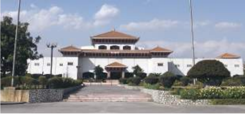
संसद भवन, काठमाडौं