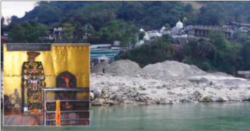
बराहक्षेत्र मन्दिर, सुनसरी

बराह क्षेत्र कोसी प्रदेशअन्तर्गतको सुनसरी जिल्लामा कोसी नदी र कोका नदीको पवित्र सङ्गममा बराह क्षेत्र नामको मनोरम तीर्थस्थल छ । भारतको कुरुक्षेत्र, नेपालका हरिहर क्षेत्र (देवघाट), मुक्तिक्षेत्र (मुक्तिनाथ मुस्ताङ), रुरु क्षेत्र (गुल्मी, पाल्पा र स्याङ्जाको सङ्गमस्थल) जस्तै बराह क्षेत्रको पनि विशिष्ट धार्मिक महत्त्व रहेको छ । बराह क्षेत्रका बारेमा बराह पुराणको ११०औँ र १४०औँ अध्यायमा चर्चा गरिएको छ । यहाँ गणेश बराह, गुरु बराह, सूर्य बराह, कोका बराह, इन्द्र बराह, गायत्री, सरस्वती, नारायणका मूर्ति र मन्दिरहरूका साथै गणेश मन्दिर, लक्ष्मी मन्दिर र धर्मशालाहरू रहेका छन् ।