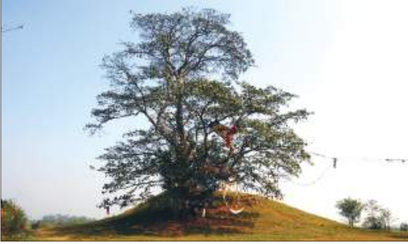
रामग्राम स्तुपा, नवलपरासी

बजारदेखि ४ कि.मि. दक्षिणपूर्वमा पर्दछ। भगवान् बुद्धको महापरिनिर्वाण भइसकेपछि बुद्धको अस्थि धातुलाई आठ भागमा विभाजित गरियो र त्यतिवेलाको प्रमुख राष्ट्रहरू (१) मगध, (२) वैशाली (३) कपिलवस्तु, (४) अल्लकप्पा, (५) कोलियनगर, (६) बधद्वीपा, (७) पाभ र (८) कुशीनगरलाई एक-एक भाग जिम्मा दिइयो, जहाँ पवित्र स्तूपहरू बनाइए। इ.पू. तिन शताब्दी पहिलेको राजा अशोकले कोलियनगरबाहेक अरू सबै देशका स्तूपहरू उत्खनन गरेर हेरे तर कोलियनगर अथवा रामग्राम स्तूपको उत्खनन गरेको छैन। यसैले बौद्ध धर्मावलम्बीहरूको आस्थाको केन्द्र रामग्राम स्तूपको अभू बढी धार्मिक र पुरातत्विक महत्त्व छ।