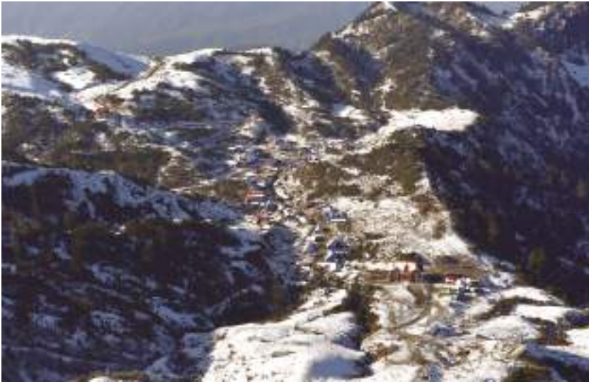
पर्यटकीय स्थल कुरी गाउँ, दोलखा

पर्यटन विकासमा पर्यटन उपज र क्रियाकलापको अपेक्षित विकास र विविधीकरण हुन नसक्नु, अन्तर्राष्ट्रियस्तरमा पर्यटन प्रवर्द्धन अपेक्षित रूपमा गर्न नसकिनु, पर्यटन पूर्वाधारको कमी हुनु, धार्मिक तथा सांस्कृतिक सम्पदाहरूको संरक्षण संवर्द्धन र पर्यटन विकासमा निजी क्षेत्रलाई पर्याप्त सहभागी गराउन नसक्नु, पर्यटन क्षेत्रको विकासमा उद्यमशीलता विकासलाई जोड्न नसकिनु, पर्यटन क्षेत्रबाट प्राप्त लाभको न्यायोचित वितरण हुन नसक्नु