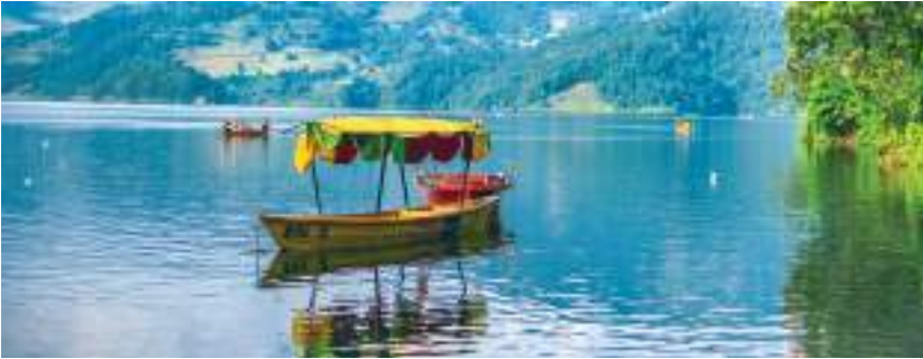
बेगनास ताल, कास्की

रूपातालसँगै पचभैया डाँडाको अर्को पाखामा बेगनास ताल रहेको छ। समुद्री सतहबाट ६७७ मिटर उचाइमा अवस्थित ७.५ मि. गहिरो यो ताल २२५ हेक्टरमा फैलिएको छ।