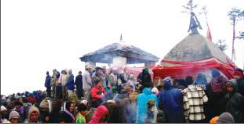
बडीमालिका मन्दिर, बाजुरा

बाजुरा जिल्लामा समुद्री सतहदेखि करिब १५,००० फिटको उचाइमा अवस्थित बडीमालिकाको मन्दिरमा भाद्र शुक्ल पक्षको दिनमा ठुलो मेला लाग्दछ। यहाँ अछाम, डोटी, बझाङलगायत देशका विभिन्न भागबाट दर्शनार्थीहरू आउने गर्दछन्।