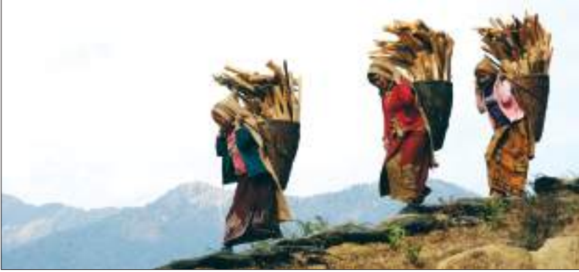
दाउराको भारी बोक्दै महिलाहरू

यो क्षेत्रमा पूर्वदेखि पश्चिमसम्म विभिन्न जातजातिका मानिसहरू बस्दछन्। पूर्वी नेपालमा मुख्यतया राई, लिम्बू बस्छन् भने मध्य नेपालमा ब्राह्मण, क्षेत्री, नेवार, मगर, गुरुङ आदि जाति पाइन्छन्। पश्चिममा पनि यिनै जाति जनजातिहरू पाइन्छन्। जात, धर्मअनुसार प्रत्येक समुदायको आ-आफ्नै भाषा, संस्कृति, रीतिरिवाज रहेको छ। यस प्रदेशमा बसोबास गर्ने मानिसले दौरा, सुरुवाल, कछाड, पटुका, टोपी आदि लगाउने गर्दछन्। यहाँका मानिस मकै, कोदो, दही, दूध, भटमासजस्ता खाद्यवस्तु तथा त्यसबाट तयार गरिएका परिकारहरू खाने गर्दछन्। यस प्रदेशका अधिकांश ठाउँमा यातायात पुगे पनि केही स्थानमा बाटोघाटोको कमी, शिक्षा तथा सञ्चारजस्ता आधारभूत आवश्यकताको कमीले गर्दा यहाँको जनजीवन पनि कष्टकर नै रहेको छ।