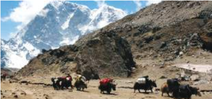
हिमाली भेगमा भारी ओसार्न चौरीगाईको प्रयोग

नेपालको सबैभन्दा उत्तरी क्षेत्रमा हिमाली प्रदेश पर्दछ । वर्षभरिमा आधाजति समय हिउँले ढाकिरहने हुनाले यहाँको भूमि कम उब्जाउशील छ । यहाँ आलु, जौ, उवा, स्याउ आदि जस्ता खाद्यान्न उत्पादन हुन्छन् ।