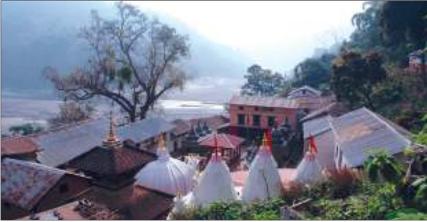
रुरु क्षेत्र, पाल्पा

बनाएकाले यसलाई रुरु क्षेत्र भनिएको हो भन्ने जनधारणा पाइन्छ। यहाँ माघे सङ्क्रान्तिमा ठुलो मेला लाग्दछ।