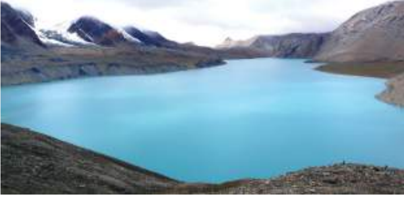
तिलिचो ताल, मुस्ताङ

तिलिचो ताल समुद्री सतहदेखि ४,९१९ मिटरको उचाइमा फाक्चे हिमालको काखमा रहेको छ । यो मनोरम ताल मुस्ताङको साँधमा अन्नपूर्ण हिमालको उत्तरी भेक मनाङ जिल्लामा पर्दछ । यो तालको लम्बाइ करिब ४ कि.मि. तथा चौडाइ १.२ कि.मि. र गहिराइ करिब २०० मिटर रहेको छ । यस ताललाई तिरि-चो वा तिलिजो पनि भनिन्छ । यस तालको उत्तरतिर नीलगिरि र दक्षिणतर्फ अन्नपूर्ण हिमालय पर्दछ । हिउँ, जल तथा ढुङ्गाको सौन्दर्यमा खुलेको हुनाले यो ताल अत्यन्तै मनमोहक छ ।