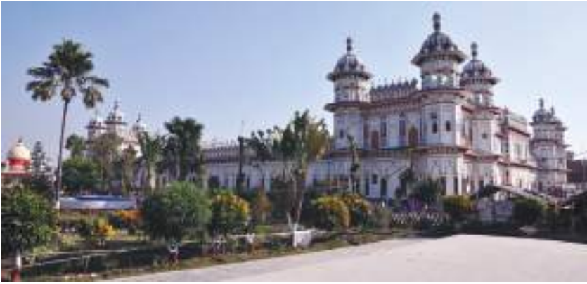
राम जानकी मन्दिर, धनुषा