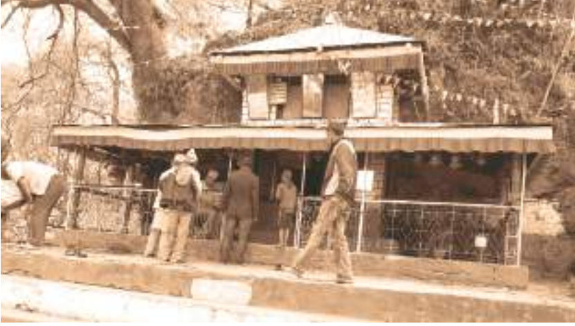
डिग्रे साईकुमारी भगवती मन्दिर, रुकुम पश्चिम

मन्दिर परिसरमा अन्य पाँचओटा मन्दिर पनि रहेका छन् ।