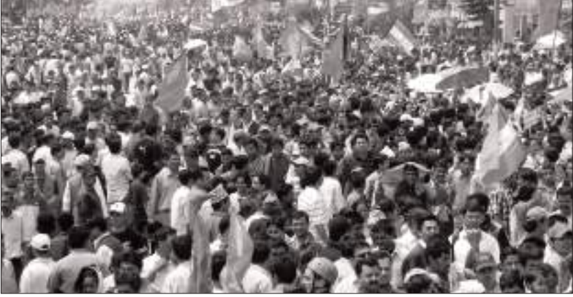
दोस्रो जनआन्दोलन २०६२/६३ को झलक

शासनविरुद्ध नेपाली कांग्रेस (प्रजातान्त्रिक) र संयुक्त वाममोर्चालाई समेत समेटेर सात दलको आन्दोलनकारी गठबन्धन बन्थ्यो र २०६२ वैशाखमा यसले प्रतियोगितासभा पुनर्स्थापनाको बाटो हुँदै नेकपा (माओवादी) ले सञ्चालन गरेको सशस्त्र विद्रोहको राजनीतिक विकास दिन संविधानसभासम्म पुग्ने साझा सहमति र प्रतिबद्धतालाई सार्वजनिक गर्‍यो। यसपछि नै माओवादीसँग सात दलको वार्ता र समझदारीले ठोस आकार र गन्तव्य लिन थालेको हो। १९ माघ २०६१ मा राजा ज्ञानेन्द्रले दोस्रो पटक निरङ्कुश एवम् प्रत्यक्ष शासन सुरु गरेपछि त्यसको प्रतिरोधमा आन्दोलन अघि बढाउन नेपाली कांग्रेस, नेकपा एमाले, नेपाली कांग्रेस (प्रजातान्त्रिक), जनमोर्चा नेपाल, नेपाल मजदुर किसान पार्टी, नेपाल सद्भावना पार्टी (आनन्दीदेवी) र संयुक्त वाममोर्चासहित २५ वैशाख २०६२ मा सर्वप्रथम सातदलीय गठबन्धन निर्माण भयो। नेपाली कांग्रेस, ने.क.पा.एमाले र ने.क.पा. माओवादीबिच २०६२ मङ्सिर ७ गते भारतको नयाँ दिल्लीमा १२ बुँदे सम्झौता भयो। शान्ति सम्झौतामा हस्ताक्षर र नेकपा माओवादीसमेतको सहभागितामा अन्तरिम व्यवस्थापिका-संसद् बनेपछि यो गठबन्धन आठदलीय भएको थियो। त्यसपछि २०६३ मङ्सिर ५ गते सात दलको सरकार र नेकपा (माओवादी) बिच विस्तृत शान्ति सम्झौता सम्पन्न भएको थियो। २०६२ साल चैत २४ गतेदेखि २०६३ साल वैशाख ११ गतेसम्म १९ दिन चलेको शान्तिपूर्ण जनआन्दोलन २०६२-०६३ मा नेपाली जनताको अपार सहभागिताले यसलाई एउटा निर्णायक बिन्दुमा पुऱ्याएको थियो। फलस्वरूप २०६३ माघ १ गते नेपालको अन्तरिम संविधान, २०६३ जारी भयो। जनआन्दोलन २०६२-०६३ पछि वर्तमान राजनीतिक सङ्क्रमणको व्यवस्थापन र संविधानसभाको चुनाव गर्ने जिम्मेवारी पाएका सात राजनीतिक दलको सहमतिअनुसार २८ चैत २०६४ मा