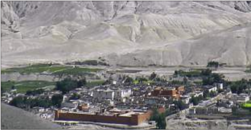
लहो मान्थाड, मुस्ताड