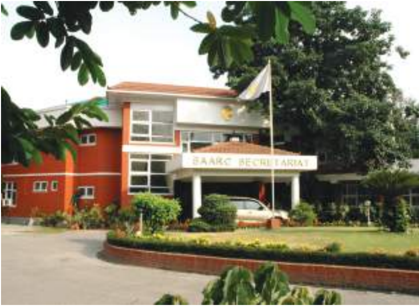
सार्क सचिवालय, काठमाडौं

परस्परमा कतिपय भिन्नता हुँदाहुँदै पनि दक्षिण एसियाली राष्ट्रहरू गरिबी निवारण एवम् आर्थिक विकाससमेतका साझा उद्देश्यहरूको परिपूर्तिका निम्ति पारस्परिक सहयोगको विस्तार गर्न वचनबद्ध भएका छन् र त्यसअनुसार दक्षिण एसियाली राष्ट्रहरूबिचको व्यापारिक सम्बन्धलाई बढी सुदृढ र सहज बनाउने हिसाबले व्यापार सहूलियतसम्बन्धी SAPTA (SAARC Preferential Trading Arrangement) सम्झौता गर्नसमेत सफल भएका छन्। SAPTA कार्यान्वयनको चरणमा रहेको पारस्परिक सहयोग र सम्बन्धलाई अझै बढी सुधार र विस्तार गर्नुपर्ने र गर्न सकिने कुरामा समेत सार्क राष्ट्रहरूको बीचमा मतैक्य नै देखिन्छ। यसले गर्दा भविष्यमा अझ बढी उपलब्धिमूलक र सशक्त संस्था सार्क हुने विश्वास लिन सकिन्छ।