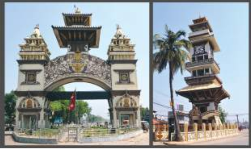
वीरगञ्ज नाका र घण्टाघर, पर्सा

मधुवनको पारसनाथ मन्दिरको नामबाट 'पारस' नाम रहन गएको पर्सा जिल्लाको सदरमुकाम वीरगन्ज हो । नेपालको मुख्य प्रवेशद्वारको रूपमा परिचित वीरगन्ज नगर नेपालको आर्थिक राजधानीको रूपमा समेत स्थापित हुँदै आएको छ । औद्योगिक तथा व्यापारिक सहर वीरगन्जको मौलिक परिचय रहेको छ । वीरगन्ज नेपालको प्रजातान्त्रिक आन्दोलनको कार्यस्थल पनि हो ।