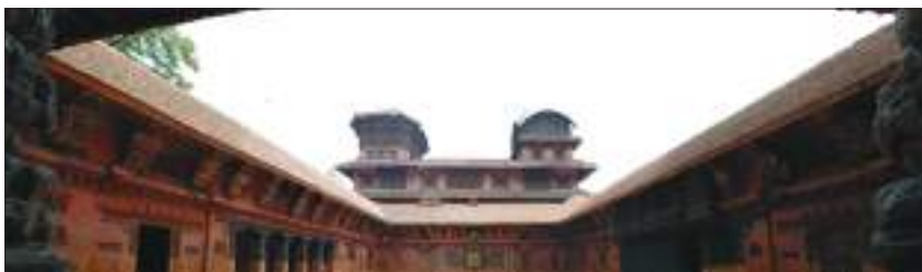
काठमाडौँ दरवार क्षेत्र