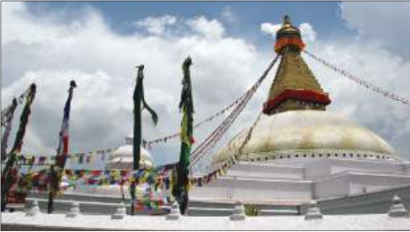
बौद्धनाथ स्तुपा, (खास्ती), काठमाडौं

काठमाडौं सहरको केन्द्रबाट ७ कि.मि. पूर्वोत्तर भागमा अवस्थित भगवान् बुद्धको ठुलो स्तूपलाई बौद्धनाथ भनिन्छ । पाचौं शताब्दीमा लिच्छवि राजा मानदेवले निर्माण गरेको यो मठ विश्वका प्राचीन विशालतम स्तूपहरूमध्ये एक मानिन्छ । हिन्दू र बौद्ध धर्मावलम्बी दर्शनार्थी आउने यो मठ धार्मिक सहिष्णुताको प्रतीक मानिन्छ । यसलाई विश्वसम्पदा सूचीमा समेत समावेश गरिएको छ ।