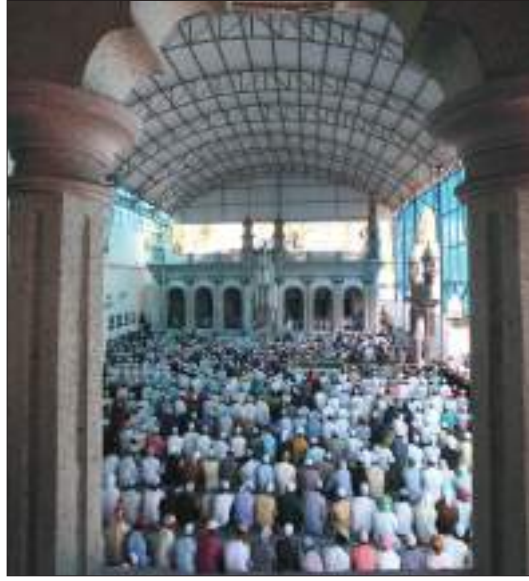
इदमा प्रार्थना गर्दै इस्लाम अनुयायीहरू

नेपालमा प्रत्येक वर्ष मनाइने विभिन्न चाडपर्वमध्ये आमा र आफ्नो देशको गुण सम्झने प्रेरणा प्रदान गर्न