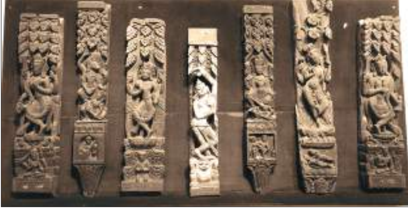
राष्ट्रिय संग्रहालयमा रहेको टुँडालहरू

पूर्वमध्यकालदेखिका काष्ठ कलाकृतिहरू प्राप्त भएका छन् । १२/१३औँ शताब्दीतिरका पाटन क्षत्रवर्ग महाविहारका सालभजिका मुद्राका टुँडालहरू, ११औँ शताब्दीका काठमाडौँको इटुमवहालका टुँडाल, १२/१३औँ शताब्दीका पनौती इन्द्रेश्वर मन्दिरका टुँडाल आदि पूर्वमध्यकालीन काष्ठकलाका विशिष्ट नमुना हुन् । मध्यकालीन तले शैलीका मन्दिरलगायतका स्मारकहरूमा प्रयोग भएका टुँडालहरू नै काष्ठकलाका उत्कृष्ट उदाहरणहरू हुन् । स्मारकको छानालाई थाम्न ४५ डिग्रीको कोणमा राखिने साधा वा कलात्मक काठलाई टुँडाल भनिन्छ ।