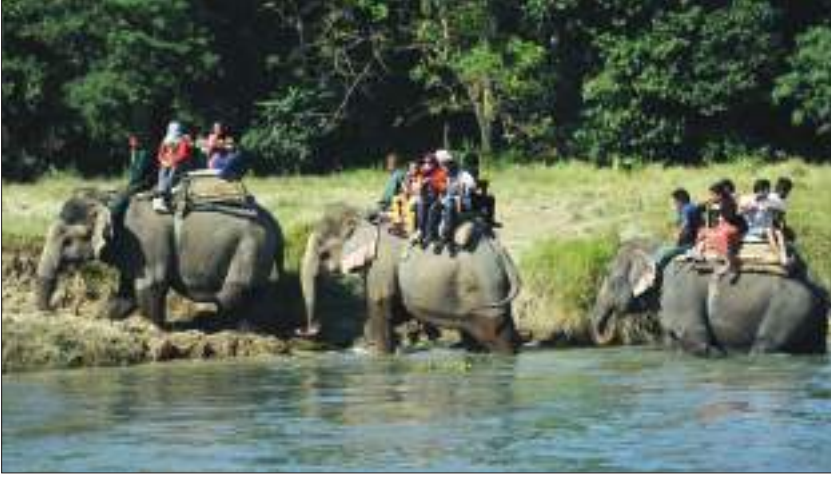
हात्ती सवारीमा निकुञ्ज क्षेत्र अवलोकन गर्दै पर्यटक

यसैगरी, घडियाल गोही, मगर गोही, अजिङ्गलगायत सरिसृप तथा उभयचर, बसाइँ सरी आएका र रैथाने गरी ५४६ भन्दा बढी जातका चराचुरुङ्गी र विभिन्न किसिमका किराफट्याङ्ग्राहरूले यस निकुञ्जलाई अझ धनी बनाएका छन्। यिनै प्राकृतिक महत्त्वका वस्तुहरूको संरक्षणलाई ध्यानमा राखी सन् १९८४ मा चितवन राष्ट्रिय निकुञ्जलाई विश्वसम्पदा सूचीमा समावेश गरिएको छ।