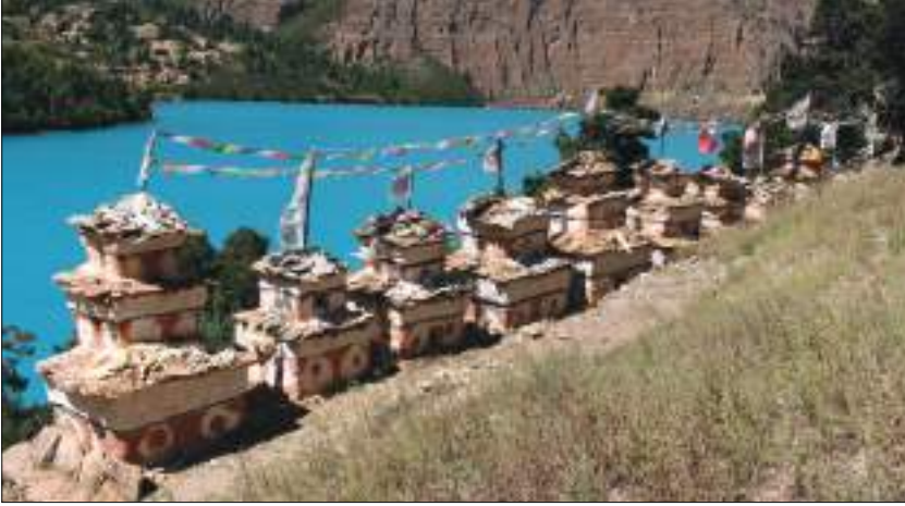
फोक्सुन्डो ताल, डोल्पा

फोक्सुन्डो ताल डोल्पा जिल्लामा अवस्थित छ । कान्जिरोवा हिमालको दक्षिण फेद तथा भेरीको मुख्य शाखा जगदुल्ला खोलाको सिरान कागमारा लेकको काखमा अवस्थित फोक्सुन्डो ताल समुद्री सतहदेखि करिब ३,६१३ मिटरको उचाइमा अवस्थित छ । यो ताल उत्तर दक्षिणतर्फ लामो एवम् पूर्व-पश्चिमतर्फ चौडा देखिन्छ । यो तालको लम्बाइ करिब ४.८२ कि.मि. तथा चौडाइ १.६१ कि.मि. रहेको छ । यस तालको स्थानीय नाम 'रिग्मो' हो । यो ताल तिनकुने लाम्चो आकारको छ । यो ताल रारा तालपछिको दोस्रो ठुलो र मुलुकको सबैभन्दा गहिरो ताल हो । यो तालको पानी अत्यन्तै चिसो भएको कारणले गर्दा यस तालमा कुनै किसिमका जीवात्मा पाइँदैनन् । यस तालको निकासको रूपमा रहेको सुलीगाड खोलामा करिब १७६ मिटरको भरना पनि छ ।