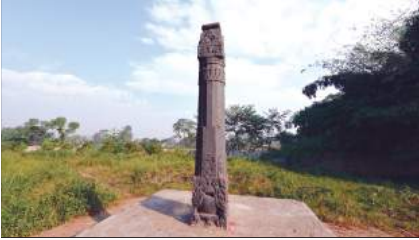
सिम्रौनगढमा रहेको स्तम्भ, बारा

सिम्रौनगढ नारायणी अञ्चलको बारा जिल्लामा पर्दछ । यसको प्राचीन नाम सिमरा-वनगढ थियो । त्यस वेला ठुला बस्ती भएका सबै क्षेत्रहरू सुरक्षाको हिसाबले गढ (किल्ला) को रूपमा परिणत गरिएका हुन्थे । यस्ता किल्लाहरू जङ्गलको विचमा समेत बनेका हुन्थे । वनभित्र बनेको गढलाई 'वनगढ' वा 'वनदुर्ग' भनिन्थ्यो । जुन ठाउँको वनमा सो गढ बनेको हुन्थ्यो त्यही नाम विशेष प्रचलित हुन्थ्यो । सिमराको वनमा रहेको गढरूपको बस्ती भएकाले नै 'सिमरा-वनगढ' भनिएको हो । यही शब्द पछि अपभ्रंश भई सिम्रौनगढ भएको हो । सिम्रौनगढवरपरको सम्पूर्ण क्षेत्र त्यसवेला तिरहुतको नामले प्रसिद्ध थियो । काठमाडौँ उपत्यकाका तात्कालिक प्रमाणहरूमा भने यो क्षेत्रलाई 'डोयराज्य' भनिएको पाइन्छ । पश्चिमको खस राज्यको स्थापना भएताका नै दक्षिण र पूर्वी तराई भेग समेटेर कर्णाटक वंशको डोप (तिरहुते) राज्य खडा भएको पाइन्छ । यसको राजधानी सिम्रौनगढ (सिमरा वनगढ) अर्थात् सिमरामा थियो । तिरहुतमा स्थापित कर्णाटक राज्य नान्यदेवले वि.सं. ११५४ (इ.सं.१०९७) मा स्थापना गरेका थिए । यो स्वतन्त्र राज्यको अस्तित्व करिब २२९ वर्ष जति रह्यो र इ.सं. १३२६ मा विघटन हुन गयो । यस राज्यमा शासन गर्ने प्रमुख शासकहरू नान्यदेव र हरिसिंहदेव थिए ।