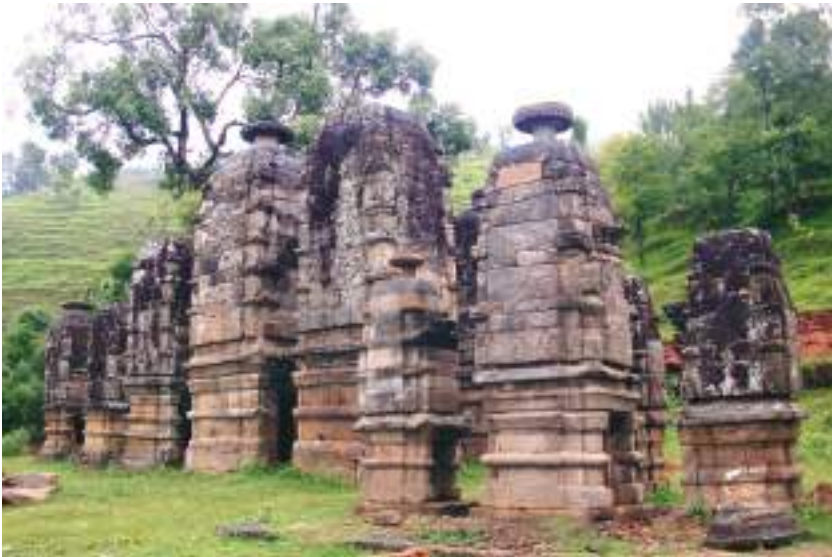
भुर्ति मन्दिर, दैलेख