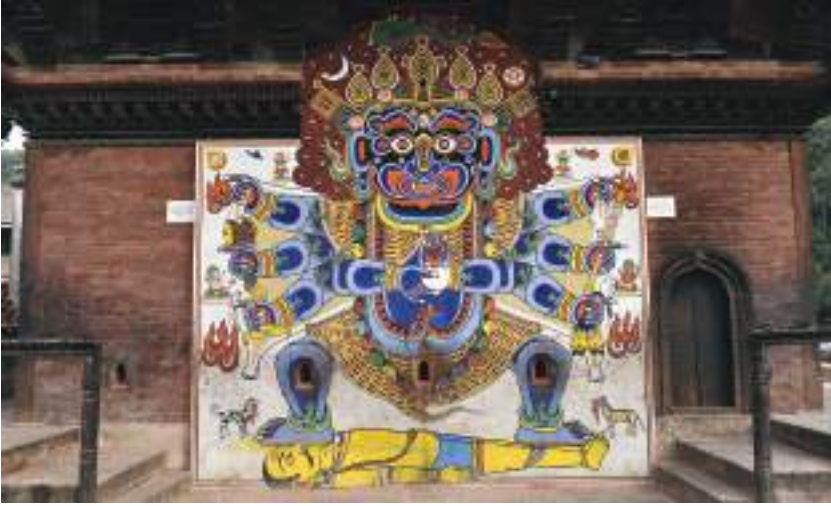
चण्डेश्वरी मन्दिरमा रहेको भैरवको चित्र, बनेपा

देवी (कुमारी) को घर मानिने कुमारी घरमा रातो र सेतो मत्सेन्द्रनाथको चित्र, पचली भैरव, भीमसेन, हिरण्यकश्यपु वध, महाङ्काल, वज्रयोगिनी, गणेश आदि देवीदेवताको र मुगल भेषमा जयप्रकाश मल्लको ६ फिट अग्लो चित्र अङ्कित छ। कीर्तिपुरको बाघभैरवमा र हनुमानढोकामा समेत मल्लकालीन चित्रकलाका नमुना देख्न सकिन्छ। भक्तपुरको तलेजु मन्दिरमा पन्ध्रौँ शताब्दीमा निर्मित कृष्णले मुरली बजाउँदै गरेको र राधाले भ्याली बजाउँदै गरेको चित्र अति रमणीय देखिन्छ। समष्टि रूपमा प्राचीन तथा मध्यकालीन चित्रकलामा धार्मिक सहिष्णुता, तान्त्रिक शैलीको बढ्दो प्रभाव, मुगल शैलीको प्रयोग तथा अनुशरण, विविध रङ तथा रोगानको प्रयोग आदि प्रमुख विशेषता पाइन्छ।