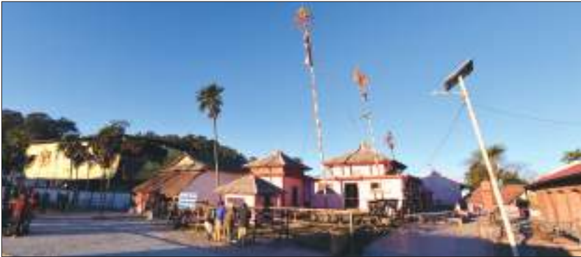
स्वर्गद्वारी मन्दिर, प्युठान

प्युठान जिल्लाको सदरमुकाम खलङ्गाबाट भन्डै २६ कि.मि. पश्चिमतर्फ ६९६० फिट उचाइ भएको लेकमा अवस्थित प्रसिद्ध धार्मिक स्थल नै स्वर्गद्वारी हो । परापूर्वकालमा ऋषिमुनिहरूले जपतप गरी स्वर्ग पुगेको भन्ने जनश्रुतिअनुसार नै यस स्थानको नाम