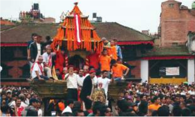
जीवित देवी कुमारी, काठमाडौँ

नेपालको मध्यपहाडी क्षेत्रमा चारैतिर पहाडले घेरेको समुद्र सतहदेखि १३३७ मिटर उचाइमा रहेको समथर भूभागमा काठमाडौँ उपत्यका अवस्थित छ । यहाँ समशीतोष्ण हावापानी पाइन्छ । काठमाडौँ नेपालको राजधानी भएकाले यहाँ जनसङ्ख्याको चाप अत्यधिक छ । काठमाडौँलाई मुलुकको राजधानी रहेको स्थानको रूपमा मात्र नभएर प्राचीनकालको इतिहास बोकेको मन्दिरै-मन्दिर र चाडपर्वहरूको बाहुल्य भएको स्थानको रूपमा समेत लिनुपर्दछ ।