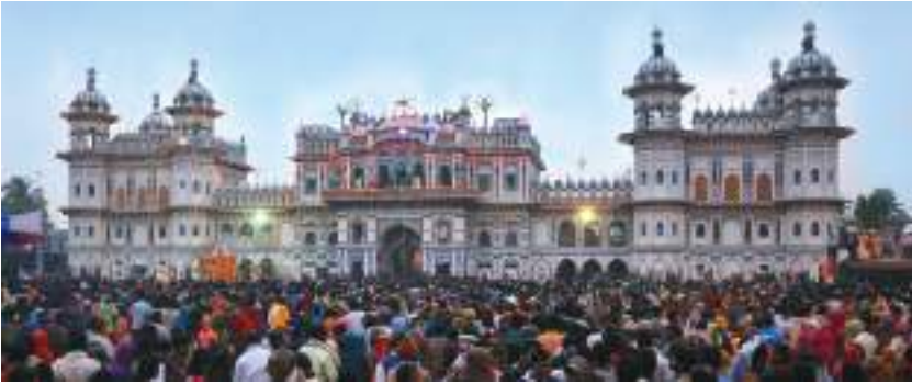
जानकी मन्दिर, जनकपुर