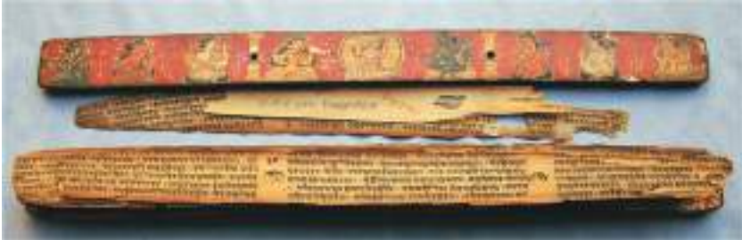
ग्रन्थ चित्र, राष्ट्रिय अभिलेखालय

नौ सय वर्षसम्म पुराना प्राचीन बौद्ध ग्रन्थहरूमा चित्रित बौद्ध चित्रहरू नै नेपालका चित्रकलाका प्राचीन नमुना हुन् । बौद्ध ग्रन्थचित्रहरूको तुलनामा हिन्दू देवीदेवताका चित्रहरू न्यून मात्रामा पाइएका छन् । यस्ता ग्रन्थचित्रहरू भारतको गुप्तकालीन अजन्ता र एलोरा शैलीसँग मिल्दाजुल्दा छन् । ग्रन्थचित्रलाई दुई वर्गमा वर्गीकरण गरिएको छ ।