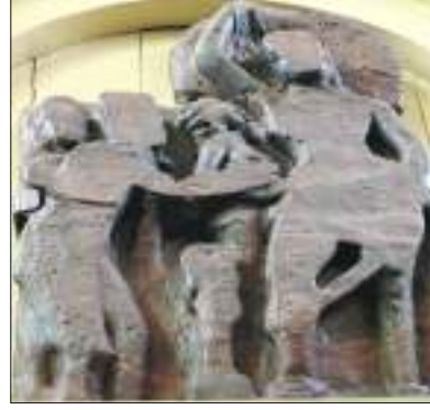
बुद्धजन्म फलक, लुम्बिनी

इसापूर्व ५६३ मा वैशाख शुक्ल पूर्णिमाका दिन बुद्धको जन्म भएको, वैशाख शुक्ल पूर्णिमाकै दिन बुद्धत्व प्राप्त गरेको र इसापूर्व ४८३ मा वैशाख शुक्ल पूर्णिमाकै दिन महापरिनिर्वाण प्राप्त गरेकाले 'वैशाख शुक्ल पूर्णिमा (स्वाँया पुन्हीं)' बुद्धजयन्तीका रूपमा मुलुकभर मनाइन्छ। यस दिन बौद्ध मठ, गुम्वा एवम् विहारहरूमा ठुलो जमघट हुन्छ।