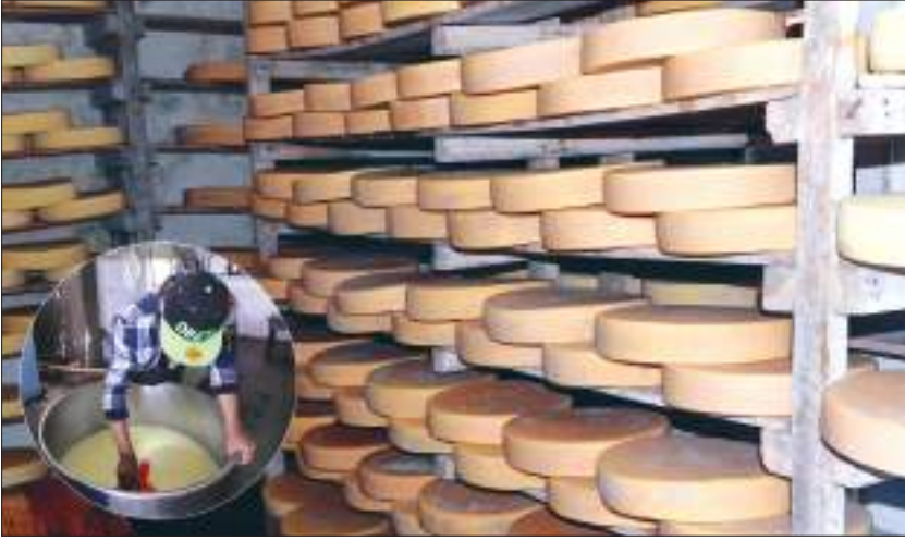
चिज उद्योग, इलाम

प्राथमिकता दिने, औद्योगिक करिडोर, विशेष आर्थिक क्षेत्र, राष्ट्रिय परियोजना, वैदेशिक लगानीका परियोजनाको सन्दर्भमा अन्तरप्रदेश तथा प्रदेश र सङ्घबीच समन्वय स्थापित गराई आर्थिक विकासलाई गतिशीलता प्रदान गर्ने नीति लिएको छ। यिनै नीतिका मार्गदर्शनबमोजिम औद्योगिक व्यवसाय ऐन २०७६, विशेष आर्थिक क्षेत्र ऐन २०७५, विदेशी लगानी तथा प्रविधि हस्तान्तरण ऐन २०७५, सार्वजनिक निजी साझेदारी तथा लगानी ऐन २०७५, औद्योगिक ग्राम स्थापना तथा सञ्चालनसम्बन्धी निर्देशिका २०७५, लगायतका कानुनी व्यवस्था गर्दै नीतिगत सुधार, संरचनागत सुधार र प्रक्रियागत सरलीकरण गर्दै औद्योगिक वातावरण निर्माणमा जोड दिइएको छ।