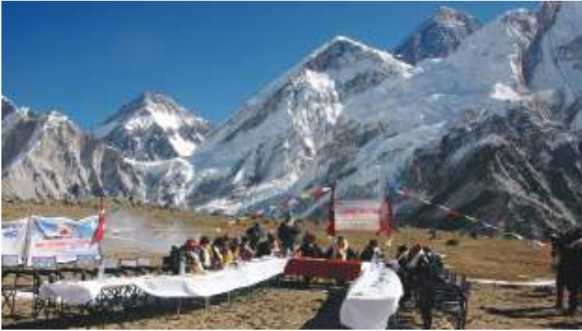
कालापत्थरमा मन्त्रिपरिषद बैठक, १९ मंसिर २०६६

नेपाल भूपरिवेष्ठित देश हो। नेपालको भौगोलिक बनावट नवीन पर्वत शृङ्खलाले बनेको छ। औद्योगिक विकास अत्यन्त न्यून भए तापनि तराई, पहाड र काठमाडौँ उपत्यकामा प्रशस्त ईटाभट्टाहरू छन्। अव्यवस्थित सहरीकरणले सहरछेउका नदीनाला अत्यन्त नराम्रोसँग प्रदूषित भएका छन्। वर्षा अनियमित छ। भूक्षयीकरण उच्च छ। वन अतिक्रमण बढ्दो छ। २०७९ फागुनसम्म भाडी बुट्यानबाहेक नेपालमा ४१.६९ प्रतिशत वन क्षेत्र रहेको छ। २०७८ फागुनसम्म यस्तो क्षेत्र ४०.४ प्रतिशत रहेको थियो। सन् १९६६ देखि नेपाल World Meteorological Organization (WMO) को सदस्य राष्ट्र भएको छ। सरकारले अन्तर्राष्ट्रिय रूपमा वातावरण संरक्षणका लागि पहल सुरु गरेको भए पनि वातावरण संरक्षणका लागि नीति सन् १९८७ मा ल्याएको थियो। पछिल्ला वर्षहरूमा खैरो क्षेत्र (Brown Sector), पानी (Blue Sector) र वन (Green Sector) को संरक्षणमा सरकार प्रयत्नशील छ।