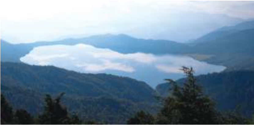
रारा ताल, मुगु