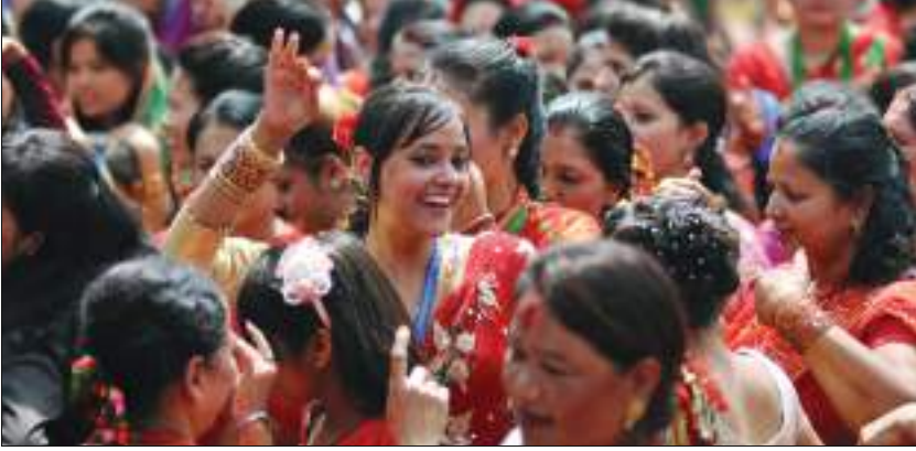
तिजमा रमाउँदै ब्रतालु महिलाहरू

तिज नेपाली नारीहरूद्वारा विशेष पर्वको रूपमा मनाइने गरिन्छ । यो चाड भाद्र शुक्ल तृतीयाका दिन पर्दछ । हिन्दू नारीहरूका लागि यो विशेष चाड हो । यस दिन नारीहरू उपवास बसी व्रत लिन्छन् । नारीहरूले इच्छाअनुसारको पति पाउनका लागि र आफू सौभाग्यवती रहनका लागि यो व्रत लिने प्रचलन छ ।