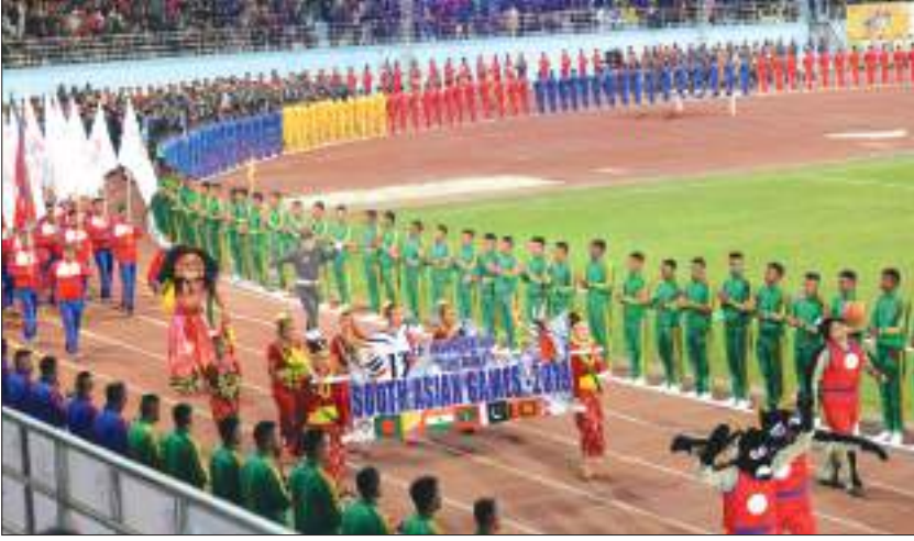
१३औं दक्षिण एशियाली खेलकुद उद्घाटन, काठमाडौं