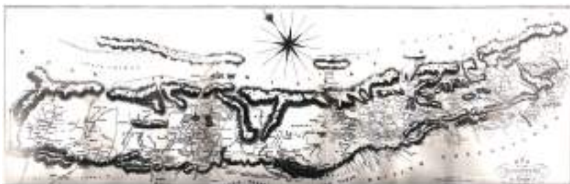
सुगौली सन्धिभन्दा अगाडिको नेपालको नक्सा।